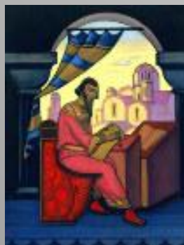
Ярослав Мудрый (Н. К. Рерих)