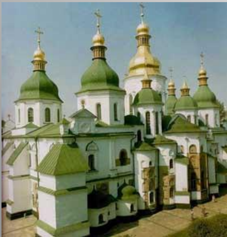
Софийский собор в Киеве