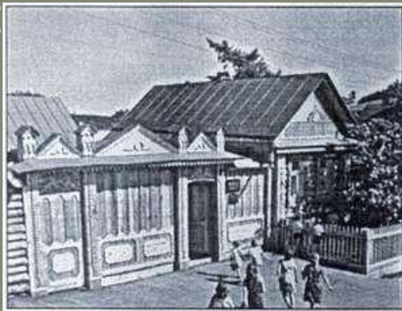
Дом-музей П.П. Бажова в

Будущий писатель, публицист, этнограф и педагог Павел Петрович Бажов родился в январе 1879 года в Сысерти. Отец будущего писателя был обычным рабочим в горной мастерской. Учился в заводской школе и духовном училище. После училища обучался в семинарии П