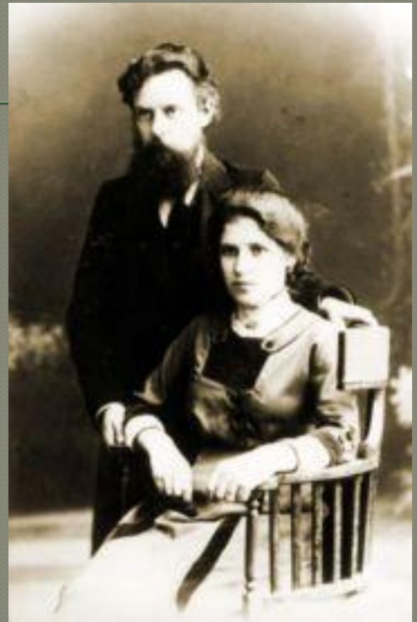
П.П. Бажов с женой

Получив образование, стал преподавать русский язык в Екатеринбурге и Камышлове. Начал педагогическую деятельность в начальной школе, продолжил – в духовном училище. Преподавал также алгебру, церковнославянский язык. Одна из его учениц стала его женой – Валентина Александровна Иваницкая. В те годы Бажов совершал первые путешествия с целью сбора фольклора – поездки на Урал дали ему множество тем для красивых сказок.