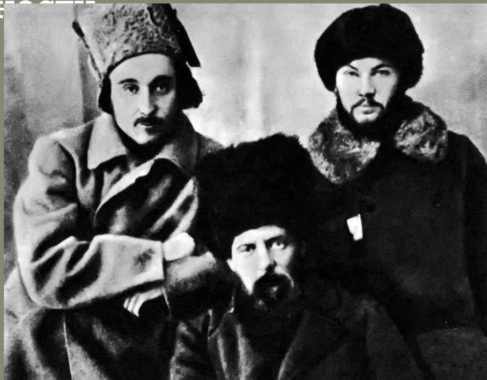
Павел Петрович Бажов с

Стал добровольцев Красной Армии. Участвовал в боевых операциях. В Ревкоме заведовал образованием, создает и координирует курсы по ликвидации безграмотности.