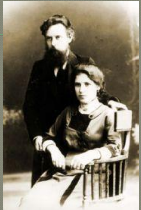
П.П. Бажов с женой