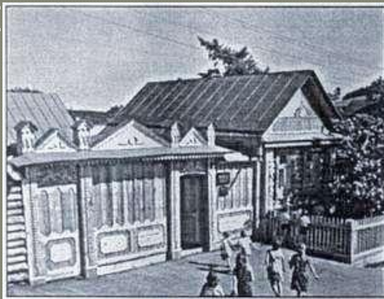
Дом-музей П.П. Бажова в

Будущий писатель, публицист, этнограф и педагог Павел Петрович Бажов родился в январе 1879 года в Сысерти. Отец будущего писателя был обычным рабочим в горной мастерской. Учился в заводской школе и духовном училище. После училища обучался в семинарии П