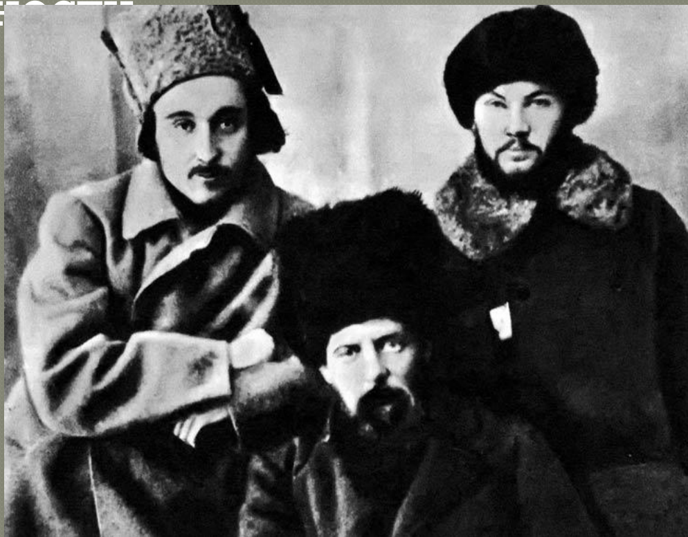
Павел Петрович Бажов с

Стал добровольцев Красной Армии. Участвовал в боевых операциях. В Ревкоме заведовал образованием, создает и координирует курсы по ликвидации безграмотности.