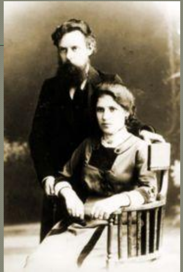
П.П. Бажов с женой