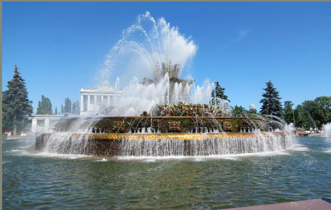
Фонтан «Каменный цветок»

Умер Бажов в 1950 году. Память о нем увековечили в фонтане «Каменный цветок» в Москве. Был основан музей, посвященный его жизни и творчеству, в Екатеринбурге. В честь автора сказок назван поселок, улицы Москвы, Челябинска, Екатеринбурга, Кургана, Усть-Каменогорска.