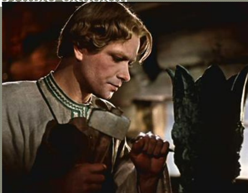
Отрывок из фильма «Каменный цветок»

Экранизации: «Каменный цветок», «Золотой полоз», «Степанова памятка», «Тайна зеленого бора». По сюжету многих сказов писателя сняты мультфильмы, поставлены спектакли. Главная тематика произведений – жизнь простого человека, мастерство умельцев. Жизнь человека писатель объединяет с мистическими сюжетами. Так родились его бессмертные сказки.