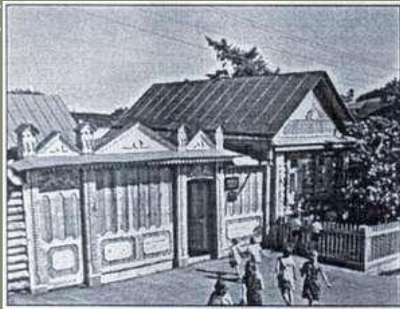
Дом-музей П.П. Бажова в Сысерти

Будущий писатель, публицист, этнограф и педагог Павел Петрович Бажов родился в январе 1879 года в Сысерти. Отец будущего писателя был обычным рабочим в горной мастерской. Учился в заводской школе и духовном училище. После училища обучался в семинарии П