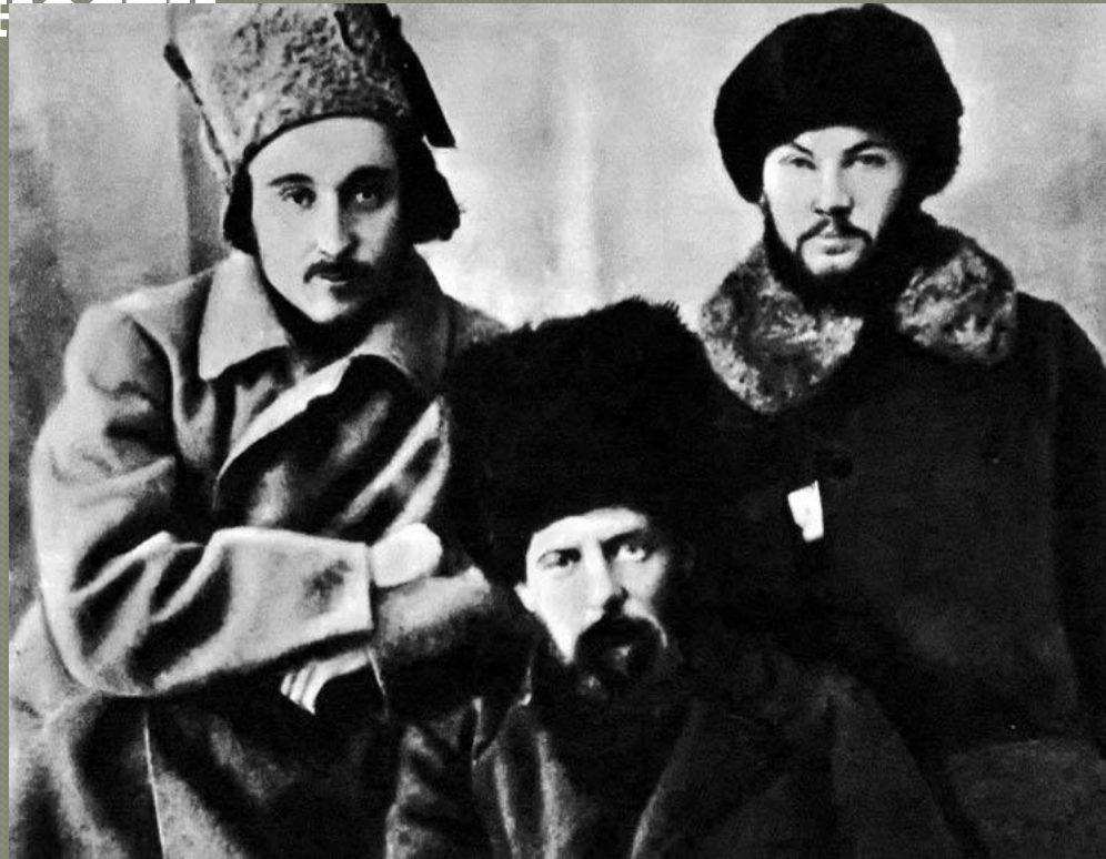
Павел Петрович Бажов с красноармейцами

Стал добровольцев Красной Армии. Участвовал в боевых операциях. В Ревкоме заведовал образованием, создает и координирует курсы по ликвидации безграмотности.