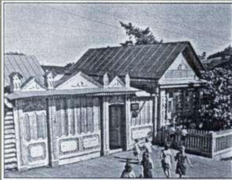
Дом-музей П.П. Бажова в Сысерти

Будущий писатель, публицист, этнограф и педагог Павел Петрович Бажов родился в январе 1879 года в Сысерти. Отец будущего писателя был обычным рабочим в горной мастерской. Учился в заводской школе и духовном училище. После училища обучался в семинарии П