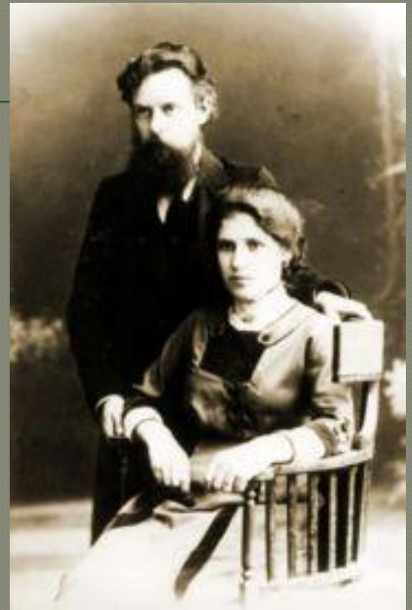
П.П. Бажов с женой