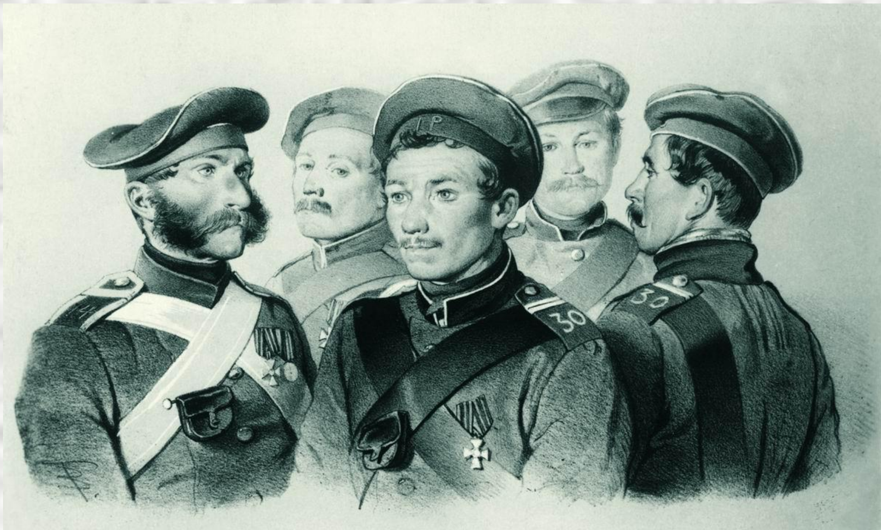
В.Ф. Тимм «Участники обороны»