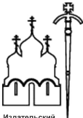
Издательский Совет Русской Православной Церкви