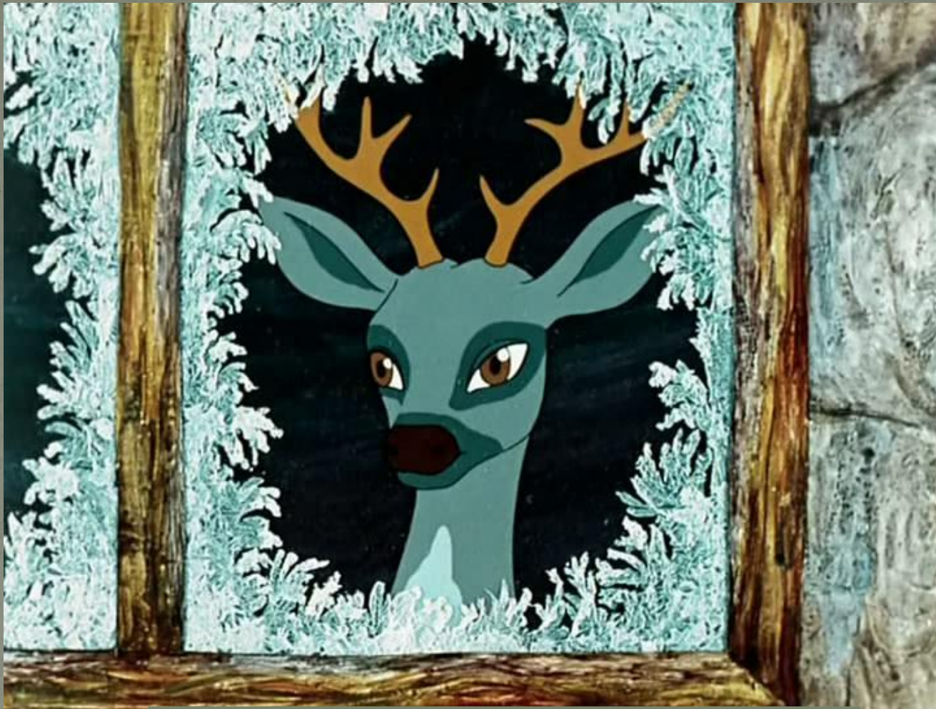
Козлик из сказа «Серебряное копытце»