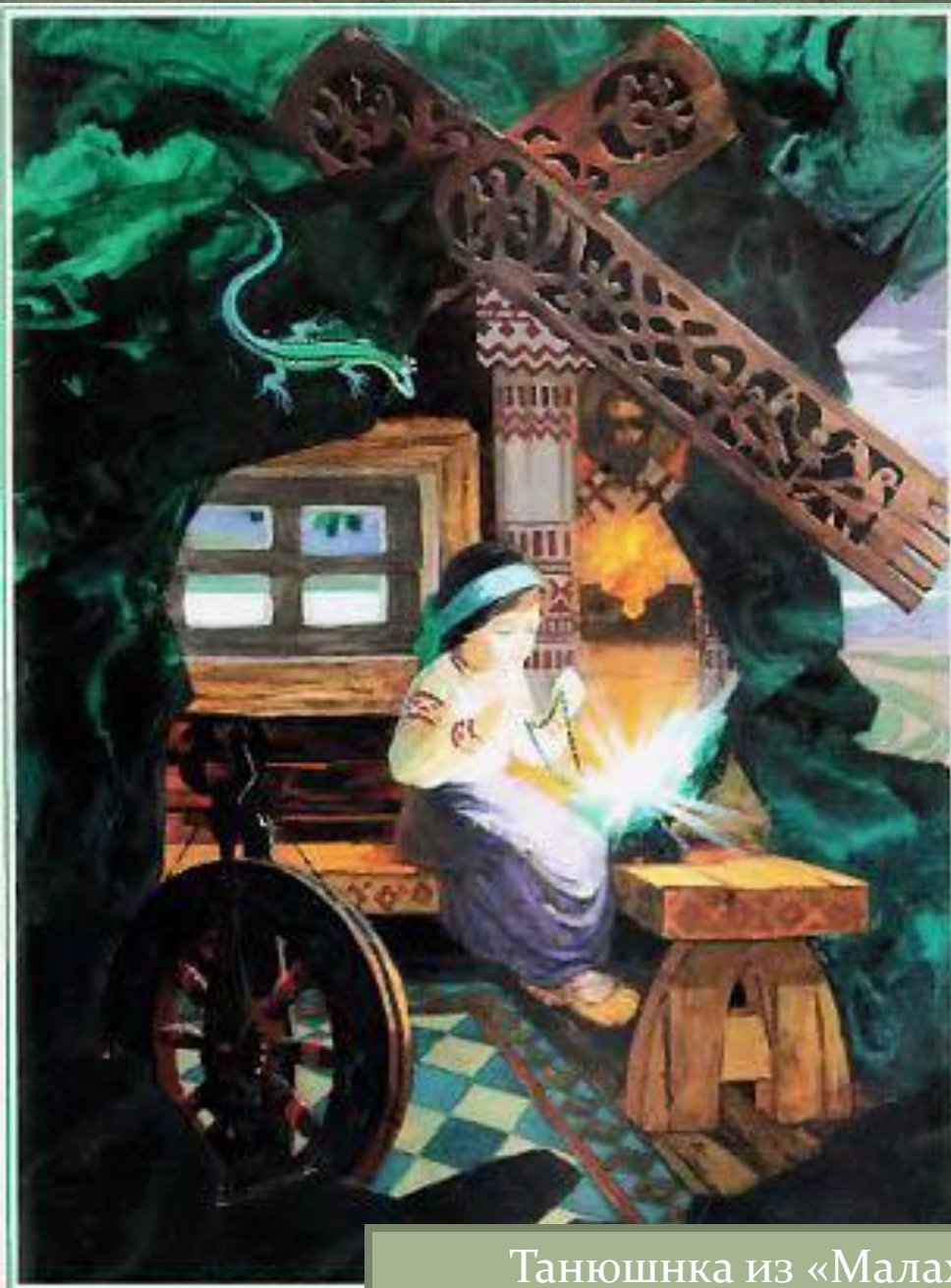
Танюшнка из «Малахитовой шкатулки»