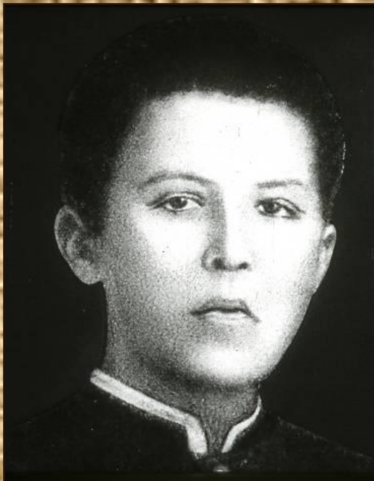
Чехов – гимназист. 1874 г.