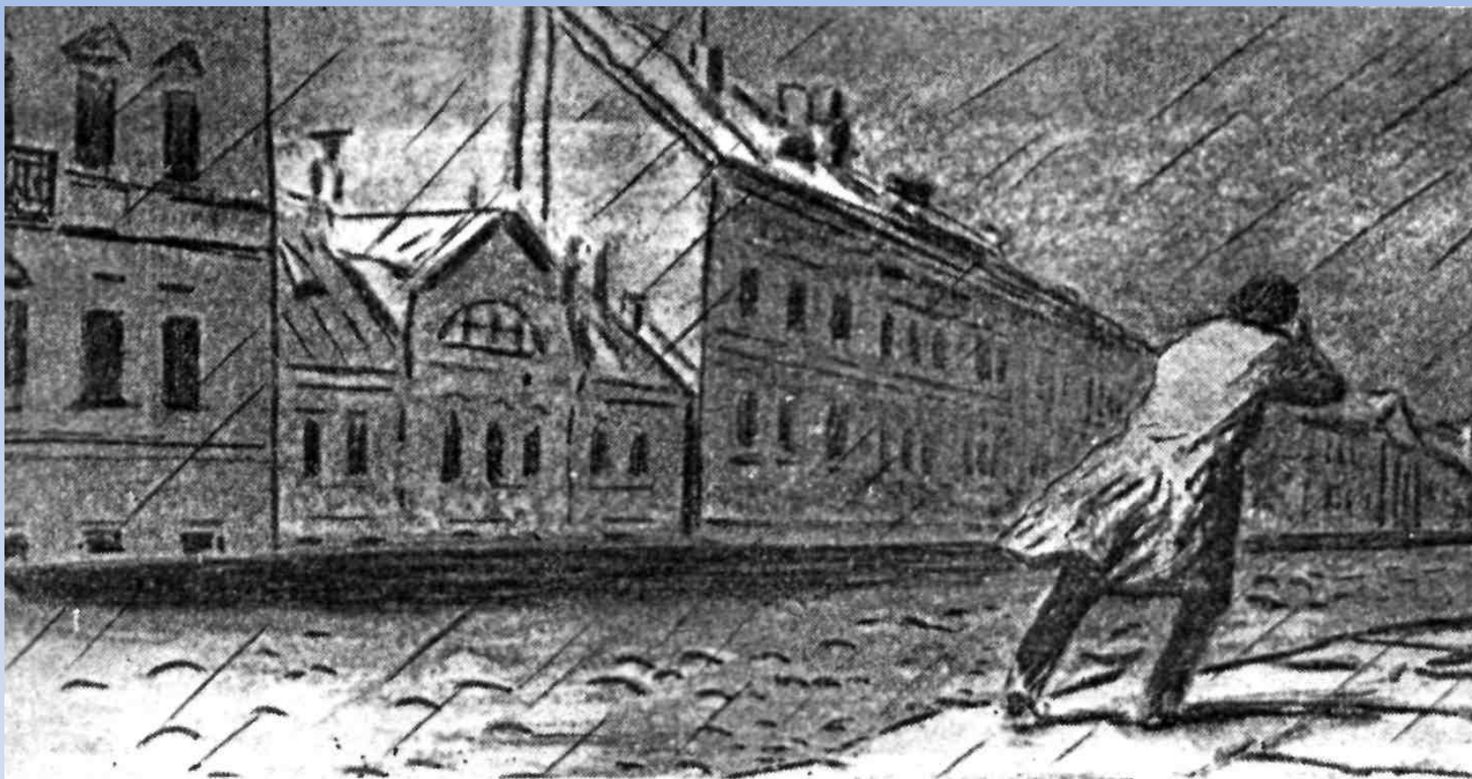
Д.Шмаринов. Иллюстрация к роману.