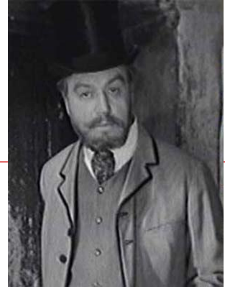
Аркадий Иванович Свидригайлов