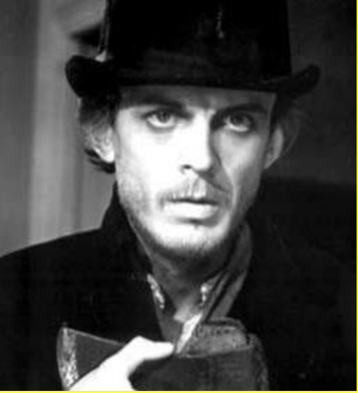
Родион Романович Раскольников