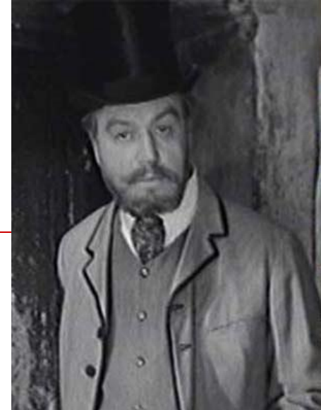
Аркадий Иванович Свидригайлов