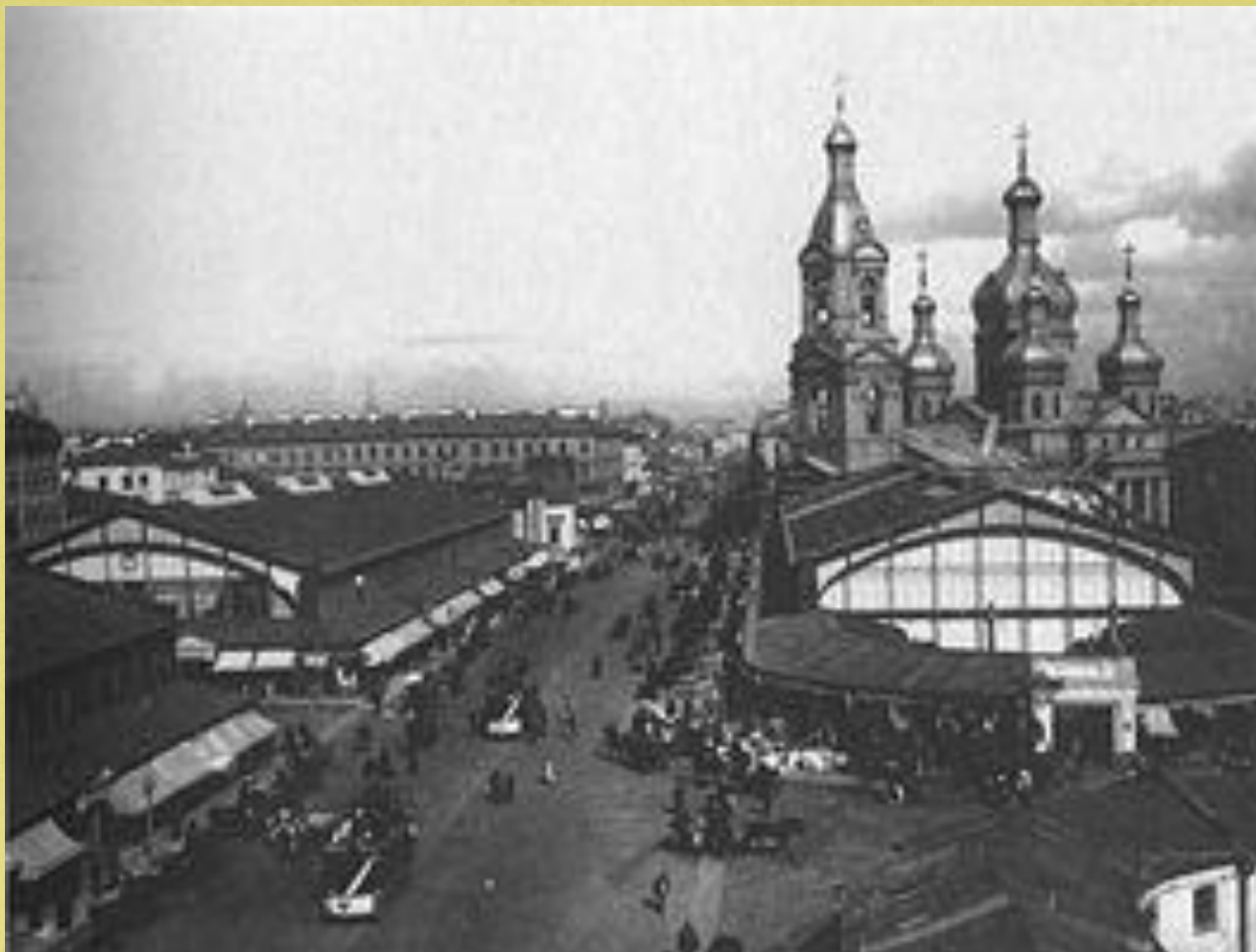
Сенная площадь, рынок на Сенной