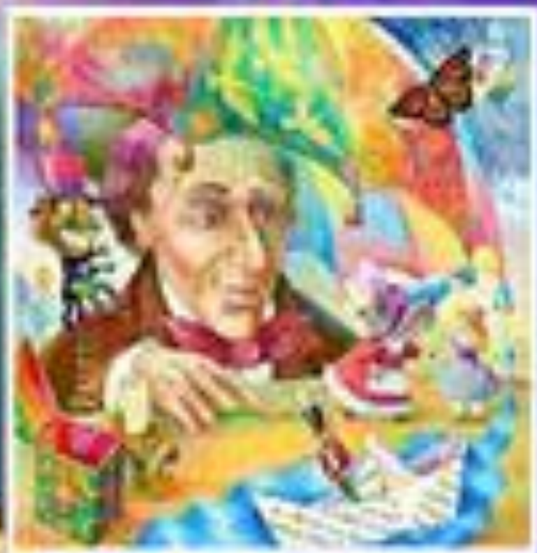
Ганс Христиан Андерсен