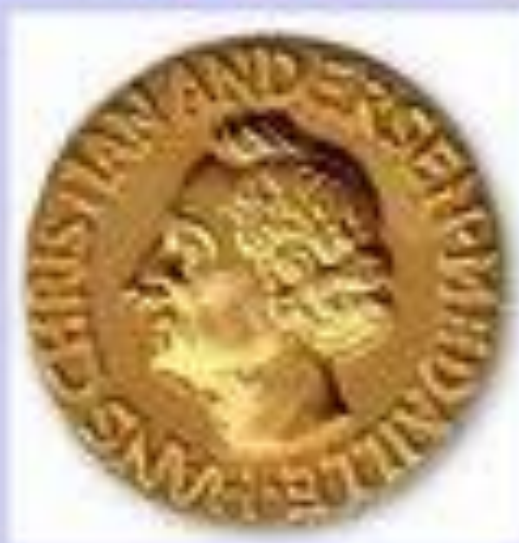
Медаль премии ГХА

Премия имени Ганса Христиана Андерсена - литературная премия, которой награждаются лучшие детские писатели (или Hans Christian Andersen Award) и художественно-мультипликационеры (или Hans Christian Andersen Award for Illustration). Премия присуждается один раз в два года и вручается в первом квартале - в день рождения Андерсена. Для «детских» авторов старшина - шеф-повар, преставляя на суд народную порода, не часто итывает «Малой Шобетеньской премией».