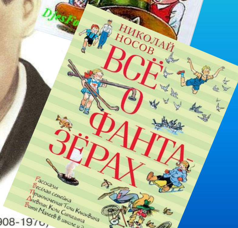
Носов Николай Николаевич (1908-1970)