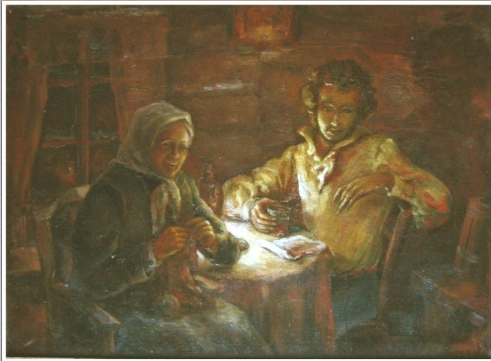
А. С. Пушкин и Арина Родионовна в Михайловском.