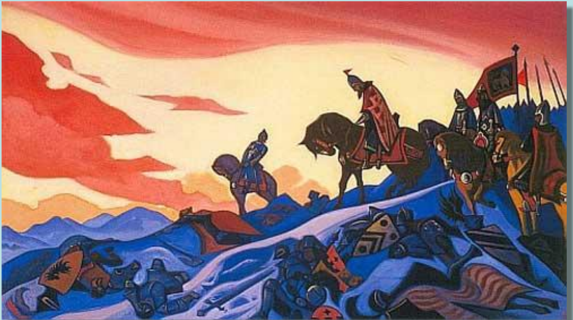
Николай Константинович Рерих