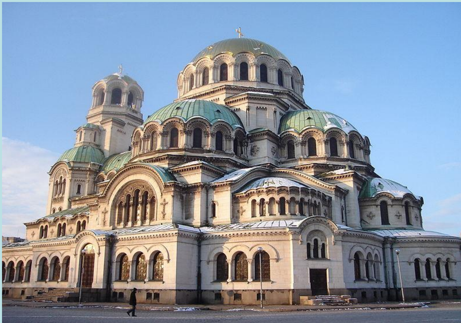
Собор Александра Невского в Софии