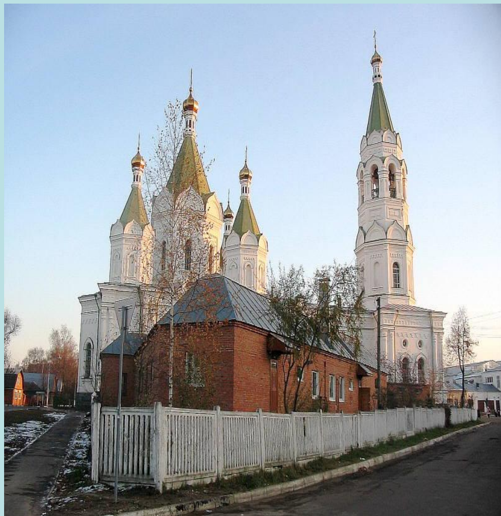
Город Егорьевск. Церковь Александра Невского.