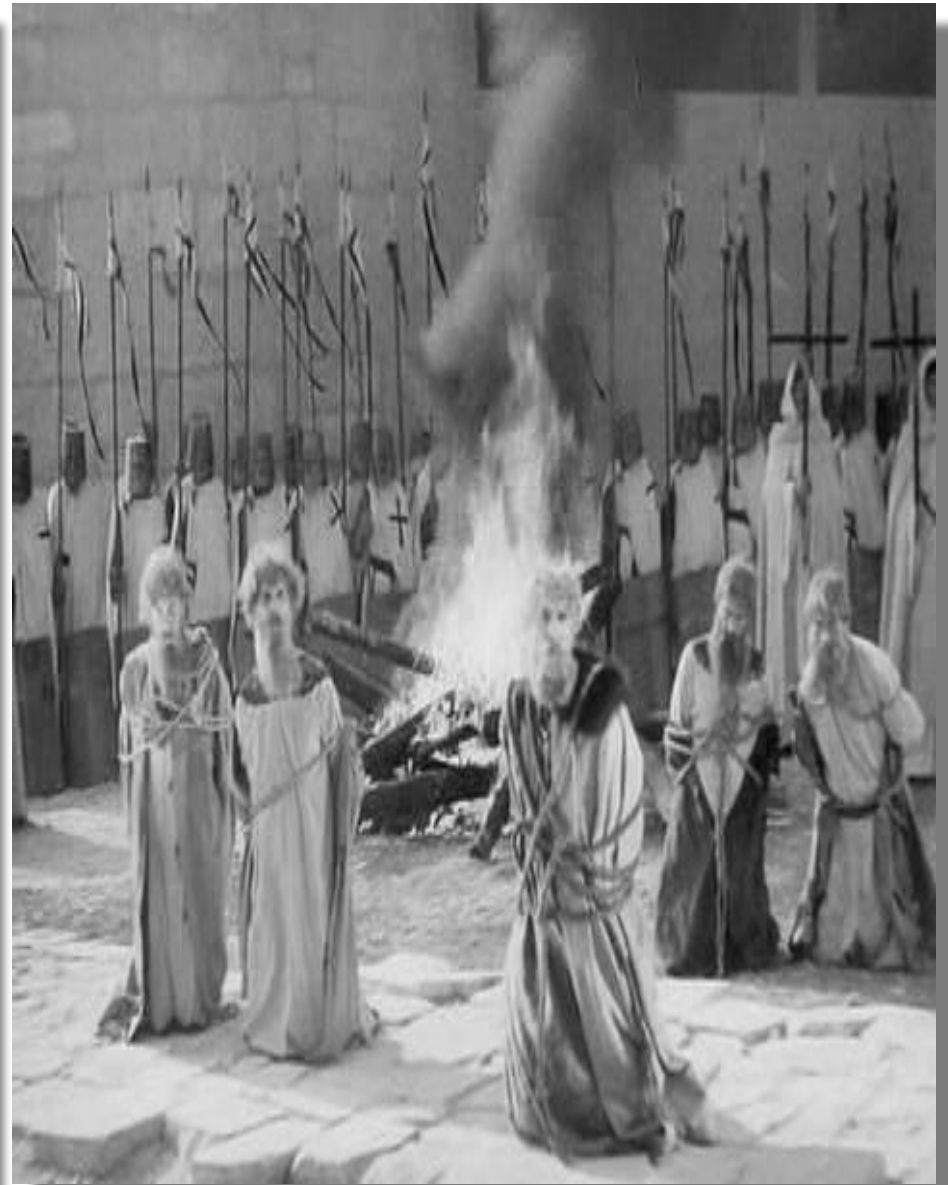
Битва на Чудском озере. «Ледовое побоище»