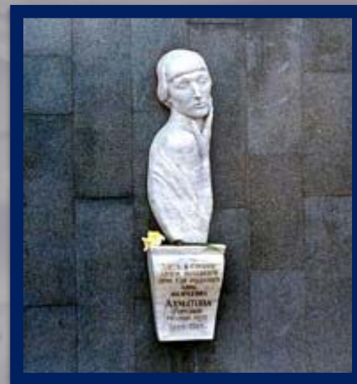
Одесса. Мемориальная доска Ахматовой

Мои первые воспоминания - царскосельские: зеленое, сырое великолепие парков, выгон, куда меня водила няня, ипподром, где скакали маленькие пестрые лошадки, старый вокзал и нечто другое, что вошло впоследствии в "Царскосельскую оду".