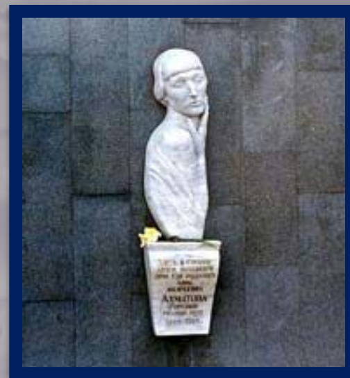
Одесса. Мемориальная доска Ахматовой

Мои первые воспоминания - царскосельские: зеленое, сырое великолепие парков, выгон, куда меня водила няня, ипподром, где скакали маленькие пестрые лошадки, старый вокзал и нечто другое, что вошло впоследствии в "Царскосельскую оду".