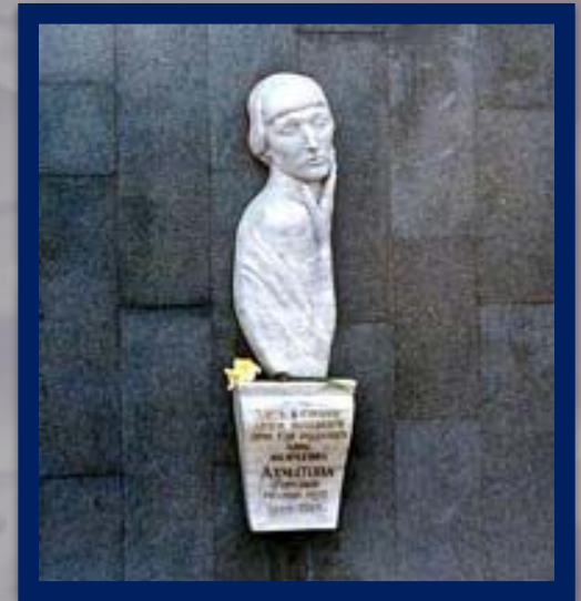
Одесса. Мемориальная доска Ахматовой

Мои первые воспоминания - царскосельские: зеленое, сырое великолепие парков, выгон, куда меня водила няня, ипподром, где скакали маленькие пестрые лошадки, старый вокзал и нечто другое, что вошло впоследствии в "Царскосельскую оду".