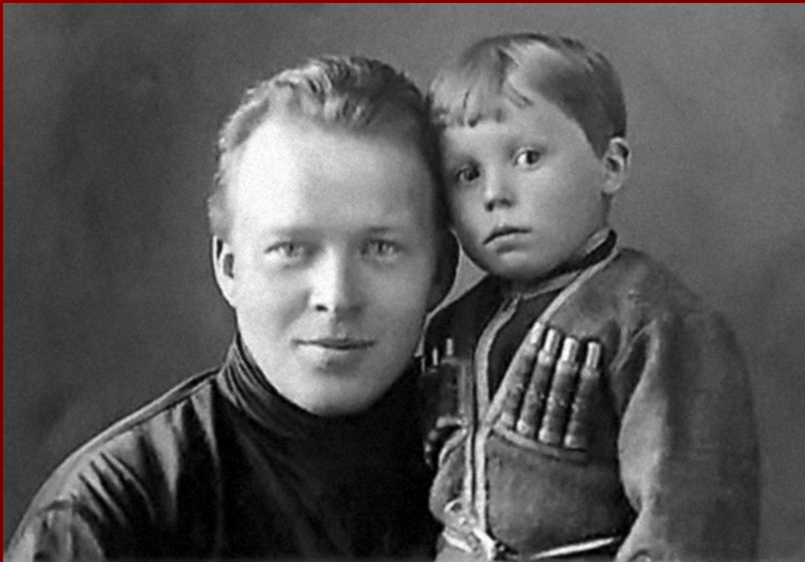
Аркадий Петрович Гайдар с сыном Тимуром