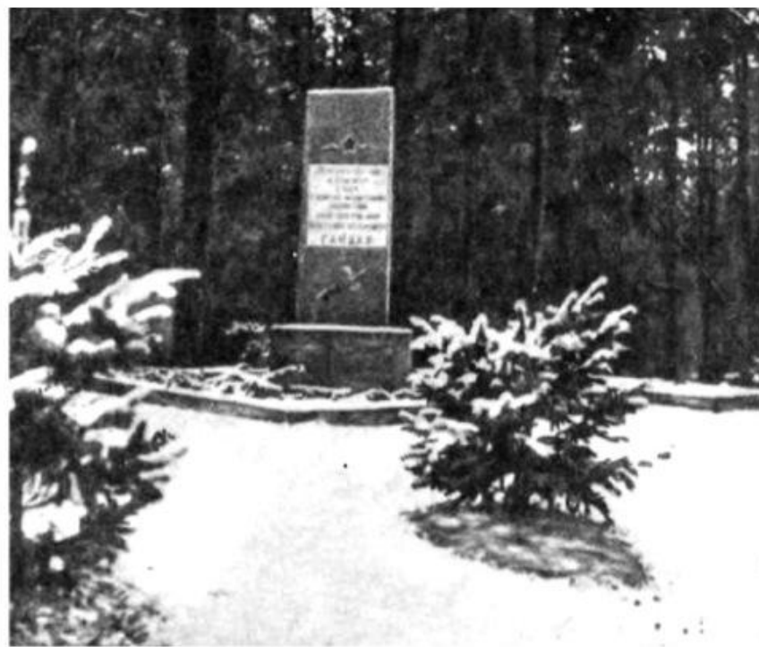
Обелиск на месте гибели А. П. Гайдара.

«Гайдар» в переводе на русский значит «всадник, скачущий впереди».