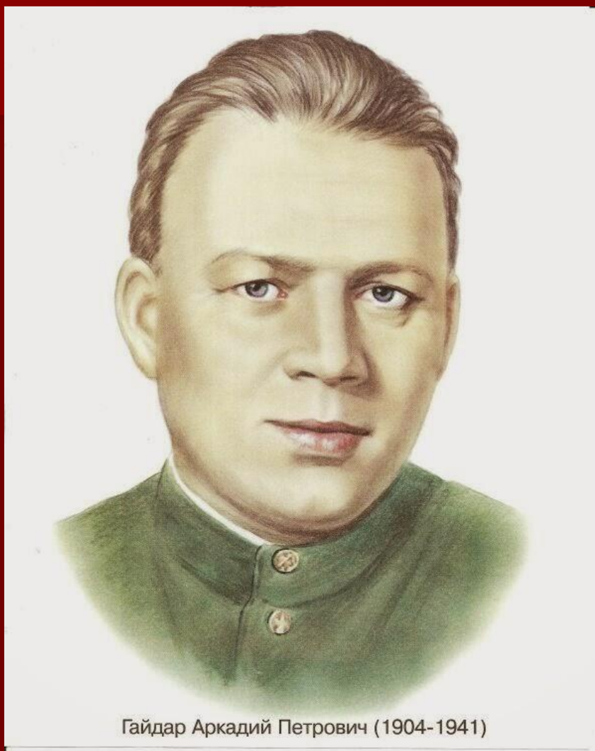
Гайдар Аркадий Петрович (1904-1941)

« Любимых детских книг творец И верный друг ребят. Он жил, как должен жить боец, И умер как солдат.»