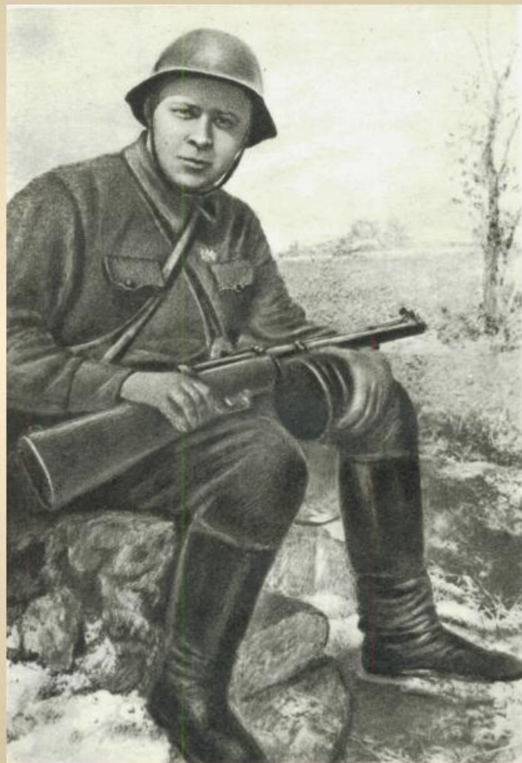
Аркадий Гайдар на фронте. 1941 год.