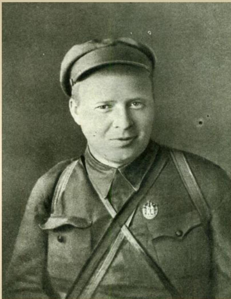
Аркадий Гайдар в Москве перед уходом на фронт. Июль 1941 года