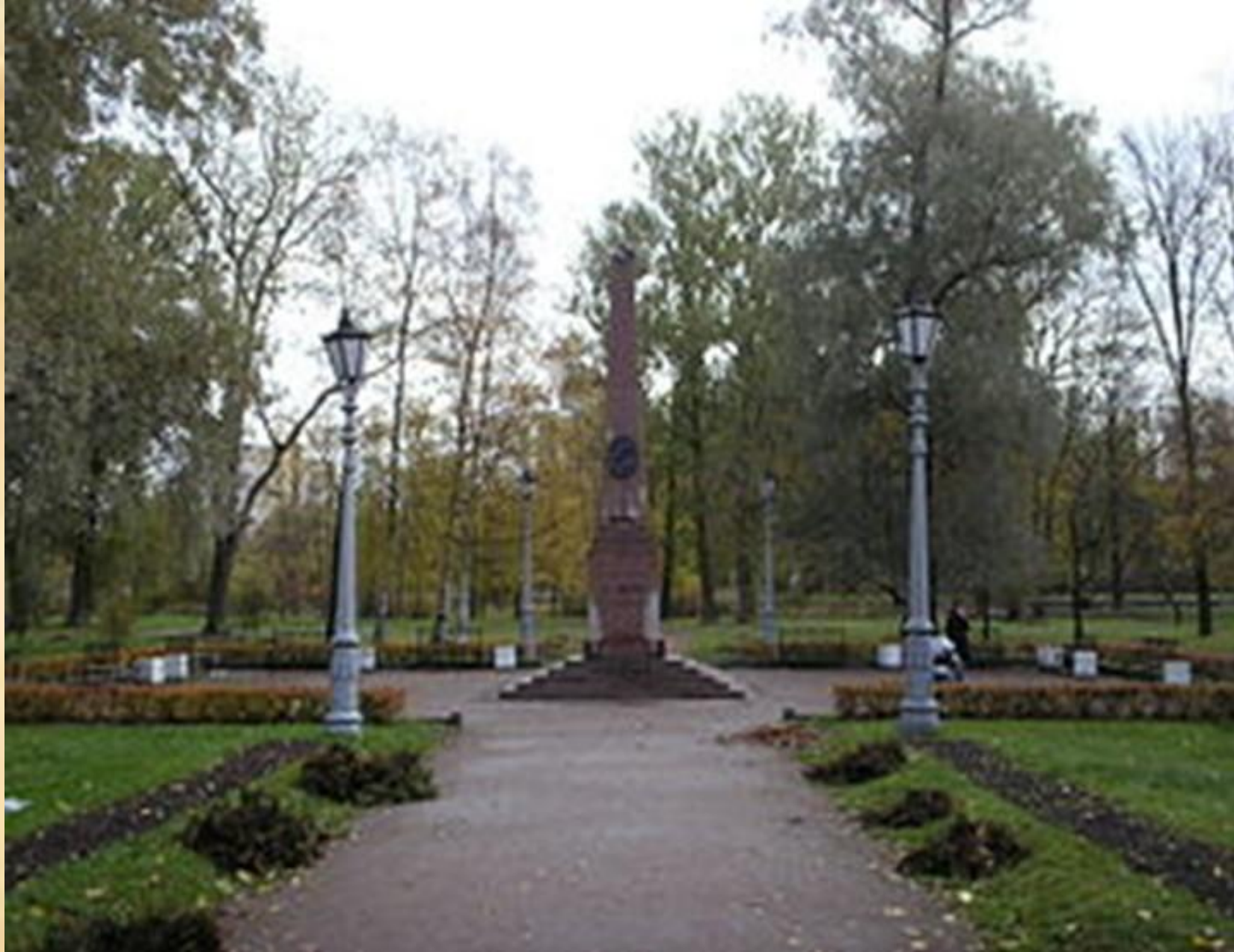
Памятный обелиск на месте дуэли Пушкина