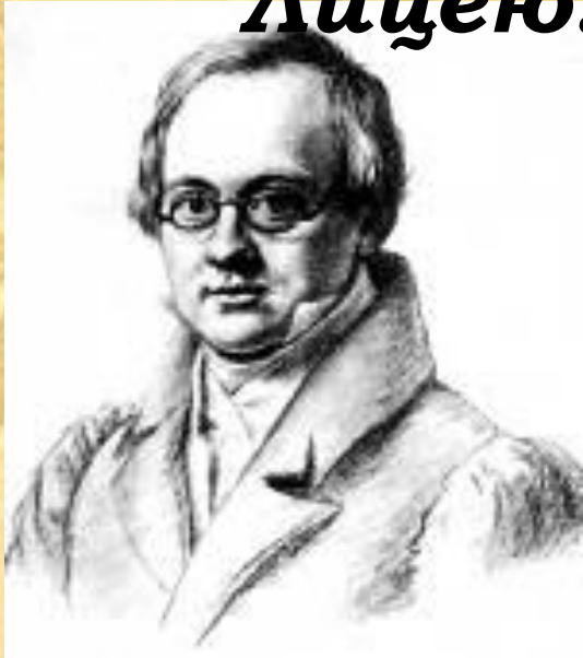
Антон Антонович Дельвиг