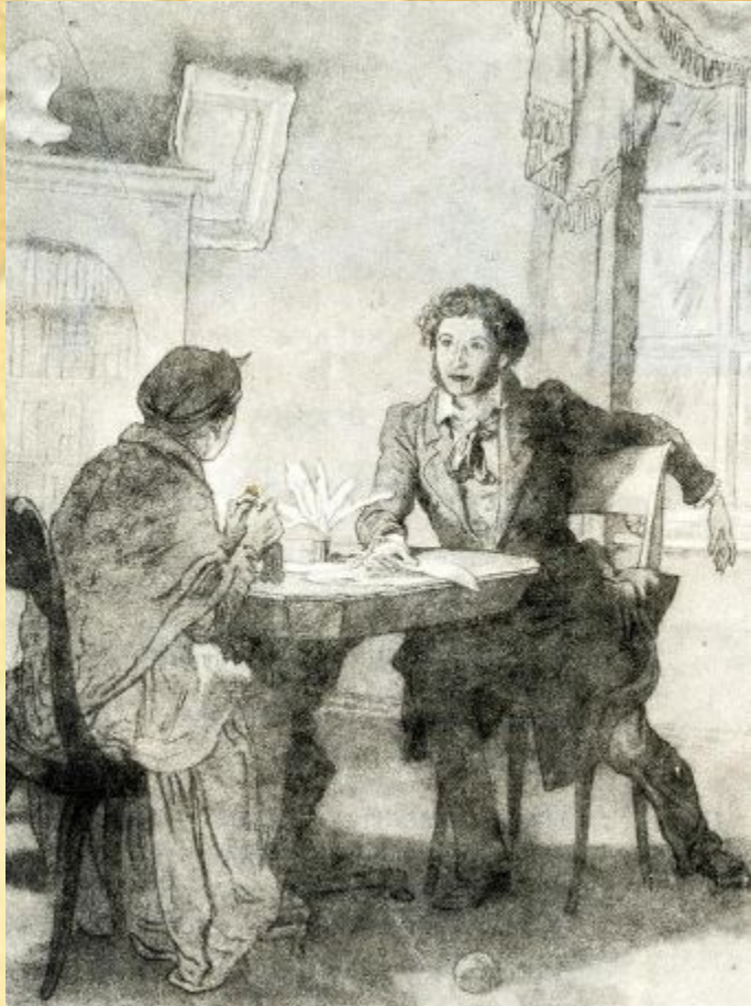
Иллюстрация к стихотворению «Зимний вечер»

Забота и любовь Арины Родионовны скрашивали поэту ссылку. Пушкин по-настоящему крепко любил свою няню и написал несколько трогательных стихотворений, к ней обращенных.