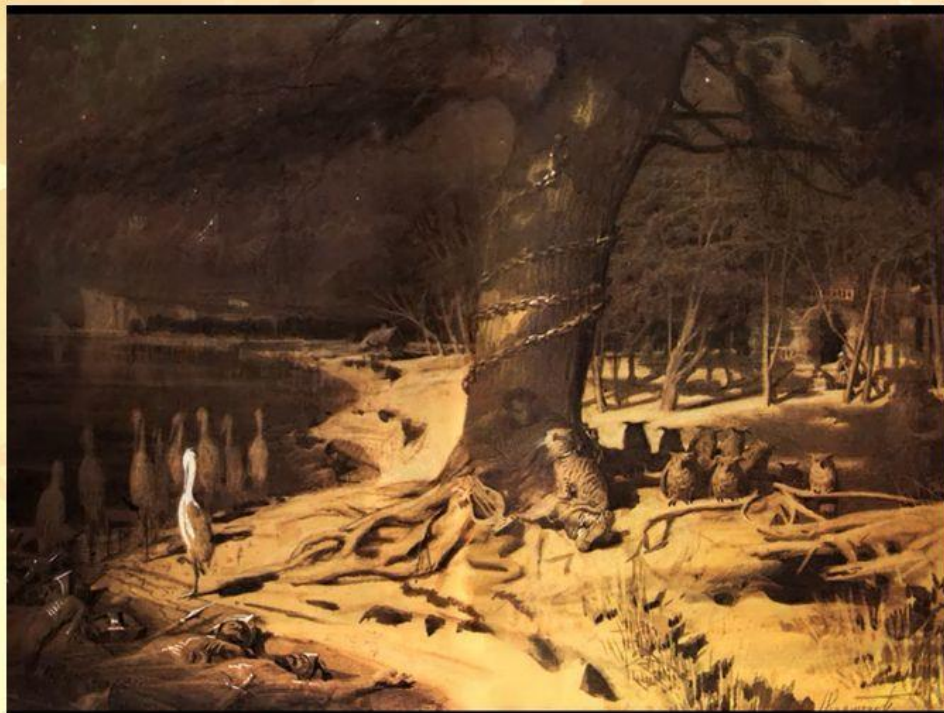
И.Н. Крамской. «Пушкин у Лукоморья»