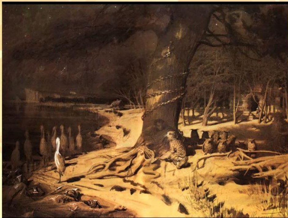
И.Н. Крамской. «Пушкин у Лукоморья»