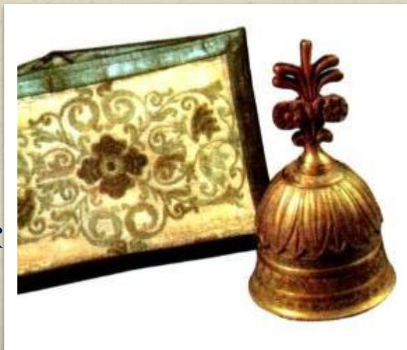
Бумажник и бронзовый колокольчик