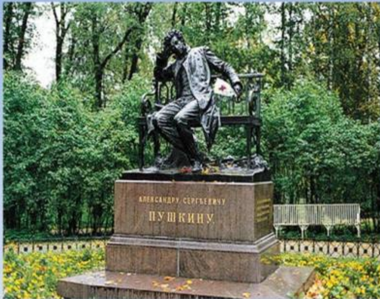
Памятник Пушкину - лицеисту в Царском селе. Скульптор Р. Бах