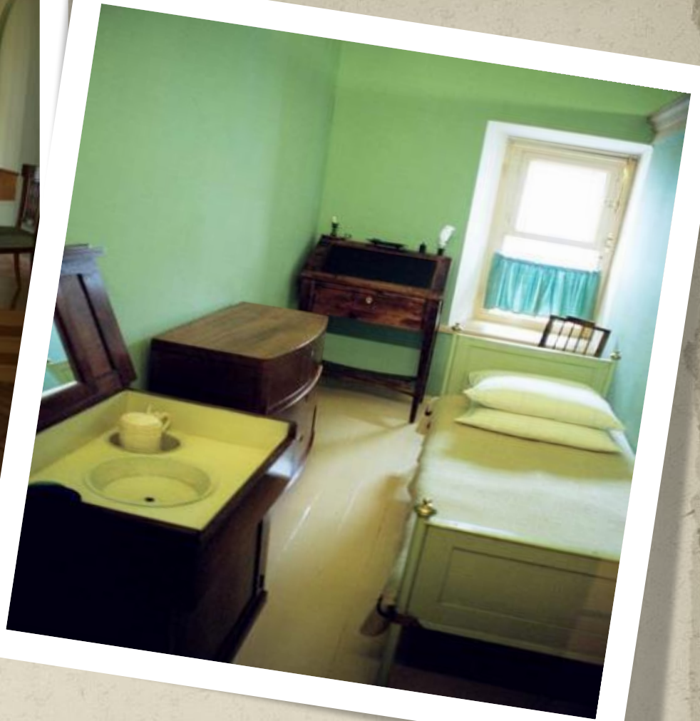
Комната лицеиста Александра Пушкина