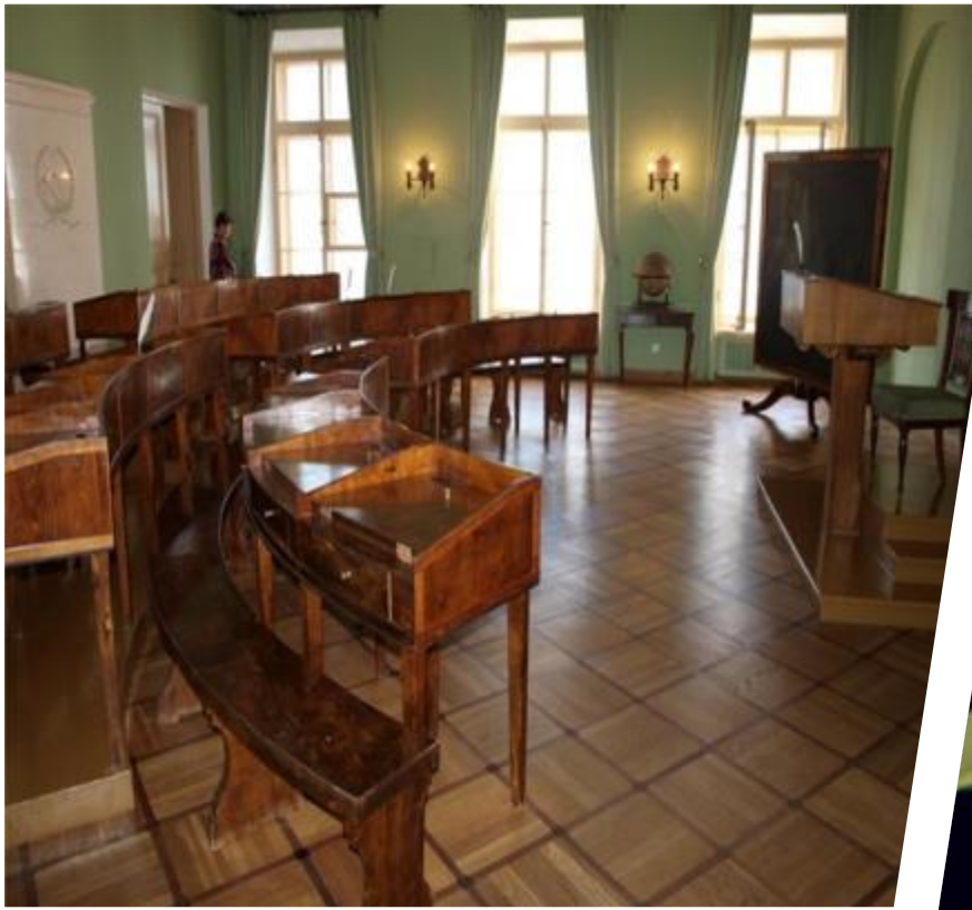
Учебная аудитория Царскосельского Лицея