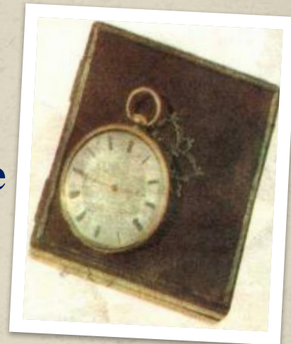
Карманные часы поэта