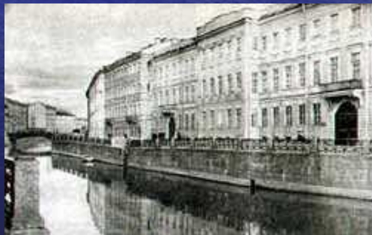
Квартира Пушкина в Петербурге на Набережной Мойки

С середины октября 1831 г. и уже до конца жизни Пушкин с семьей живет в Петербурге.