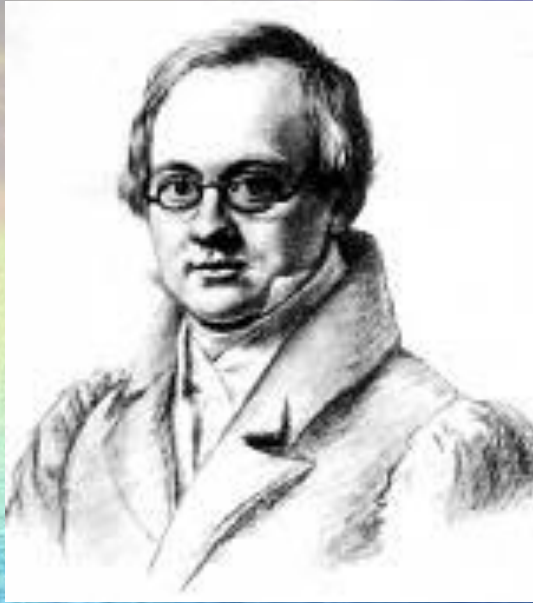
Антон Антонович Дельвиг