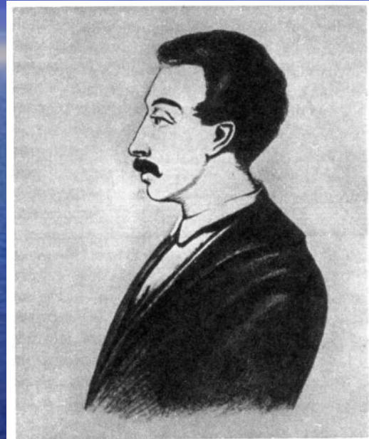
Вильгельм Карлович Кюхельбекер