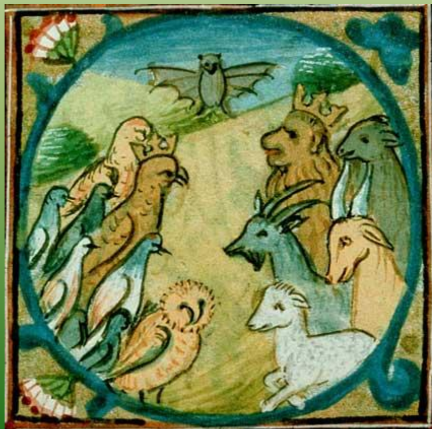
Рисунок 15 века к басням Эзопа

Эзоп - древнегреческий баснописец, раб, жил в 6 веке до н.э., был очень остроумным и популярным человеком своего времени, считается родоначальником жанра басни