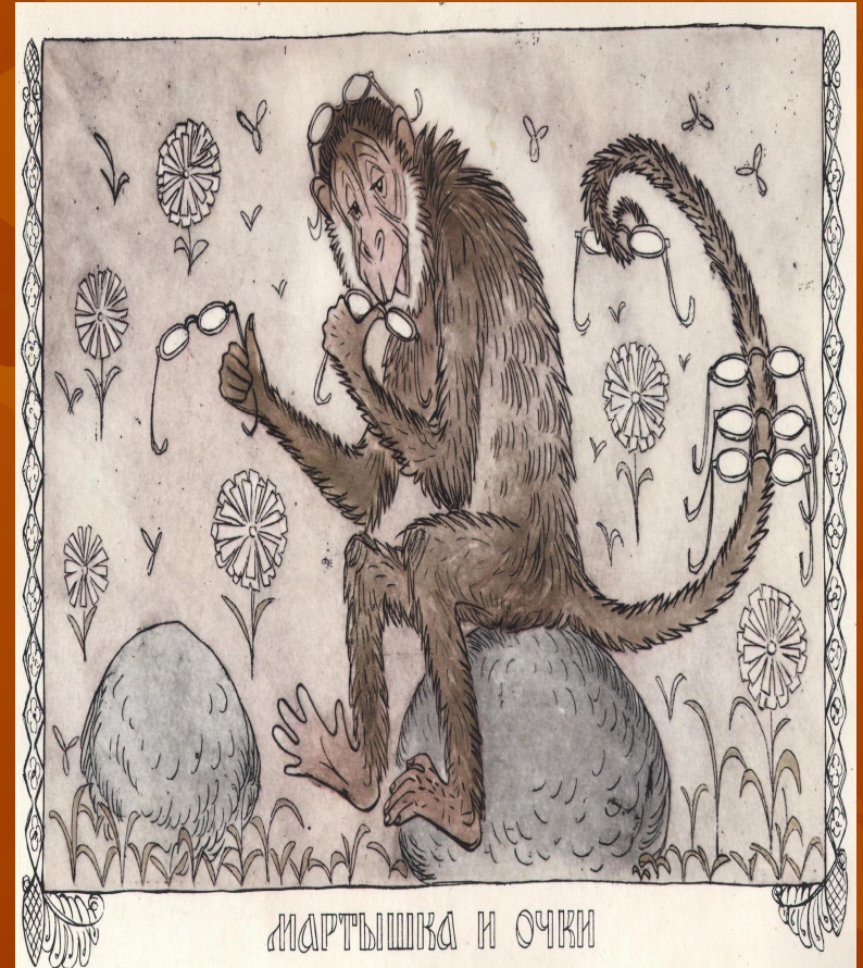
МАРТЫШКА И ОЧКИ

К несчастью, то ж бывает у людей: Как ни полезна вещь – цены не зная ей, Невежда про неё свой толк всё к худу клонит; А ежели невежда познатней, Так он её ещё и гонит.