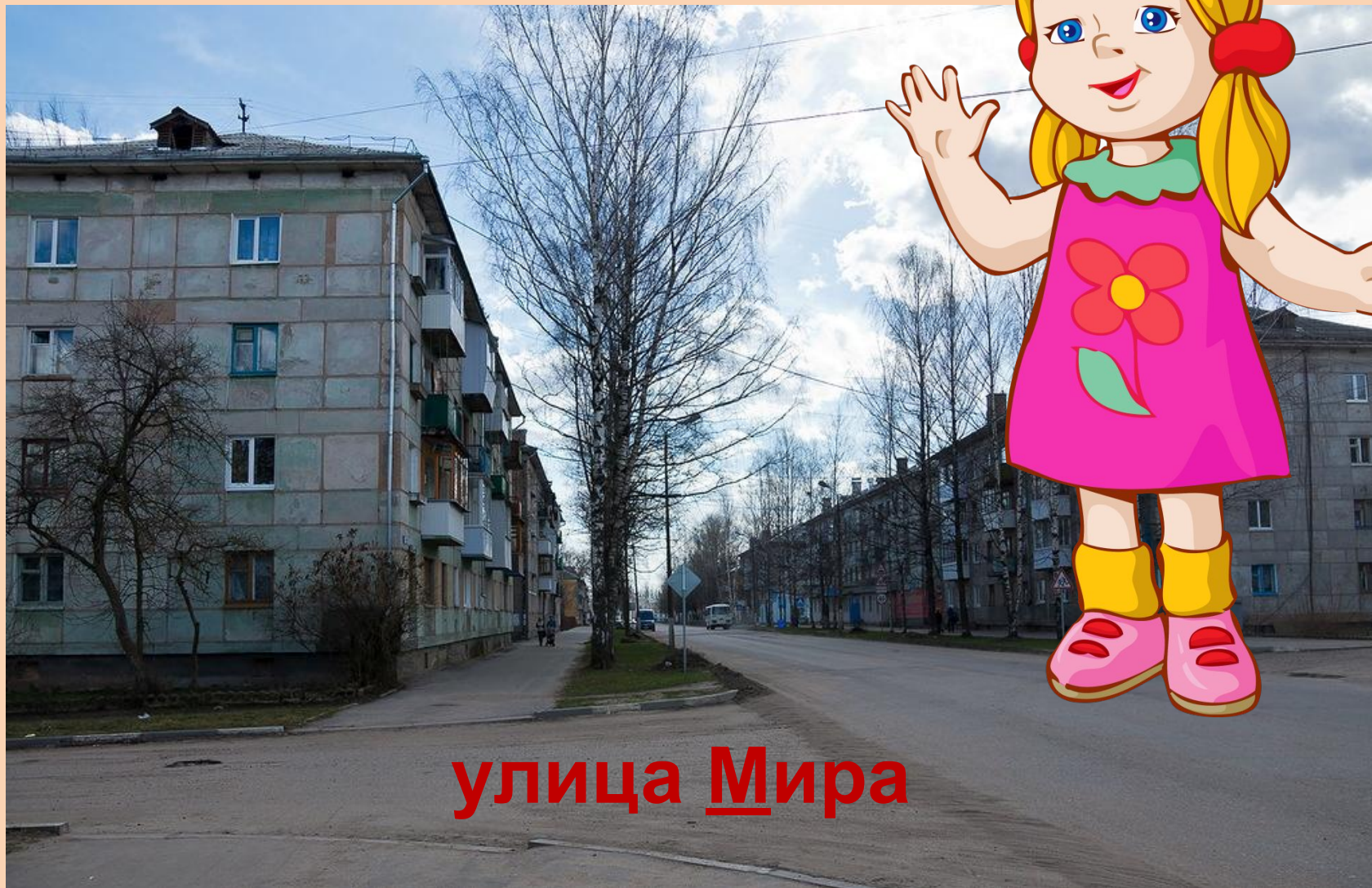
улица М ира