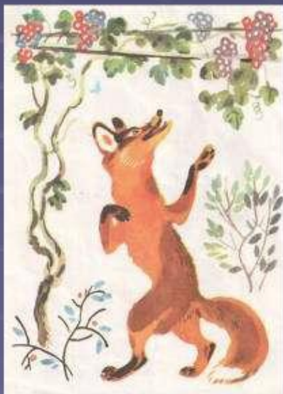
Лисица и виноград