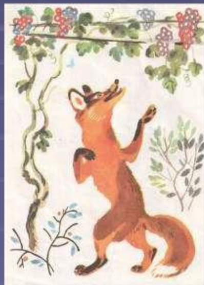
Лисица и виноград