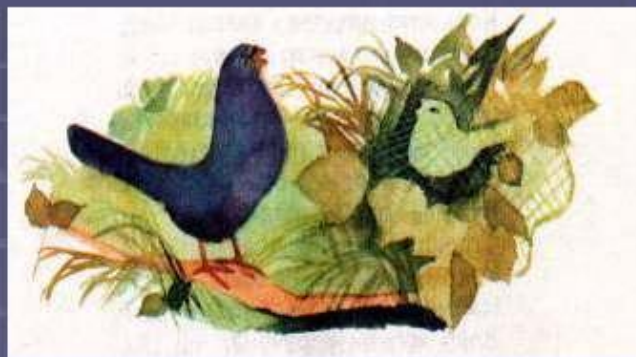
Чиж и Голубь