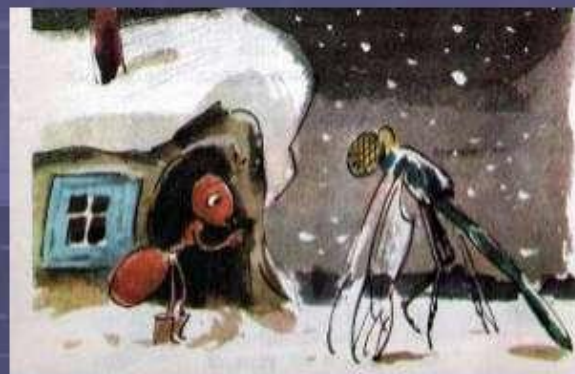
Стрекоза и Муравей