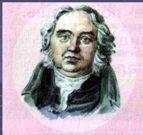
Иван Андреевич Крылов