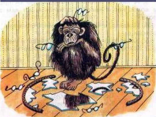
Мартышка и очки