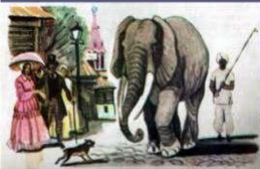
Слон и Моська