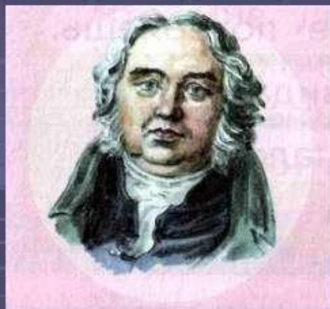
Иван Андреевич Крылов