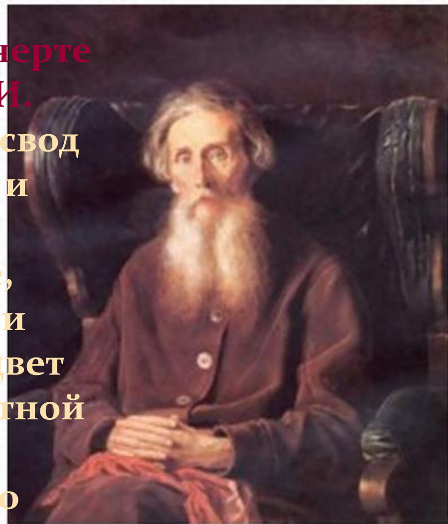
Даль Владимир Иванович

Даль: Пословица - это «свод народной премудрости и суемудрия, это стоны и вздохи, плач и рыдание, радость и веселье, горе и утешение в лицах; это цвет народного ума, самобытной стати; это житейская народная правда, своего рода судебник, никем не судимый».