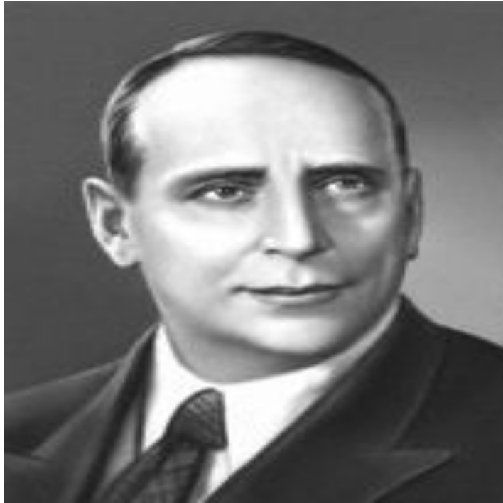
Евгений Львович Шварц (1896 – 1958)