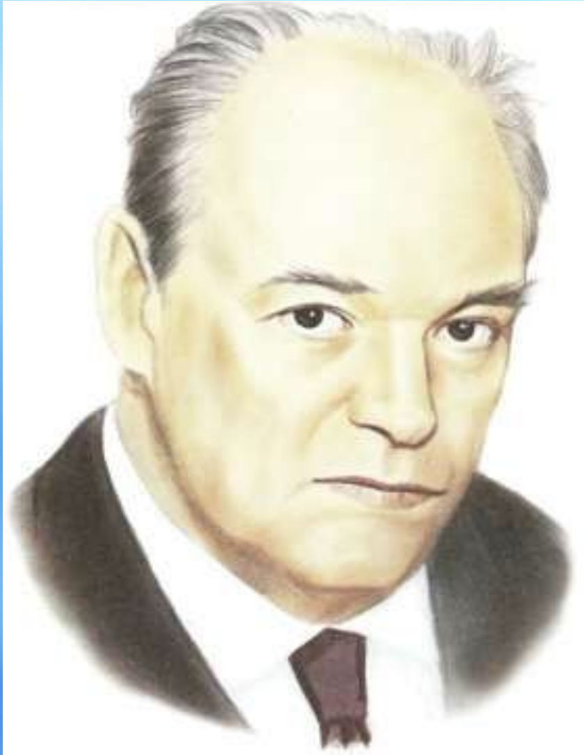
Чарушин Евгений Иванович (1901-1965)