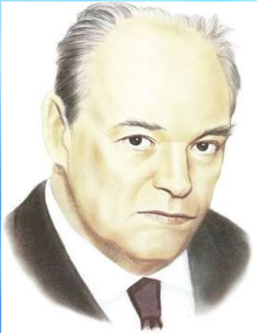
Чарушин Евгений Иванович (1901-1965)