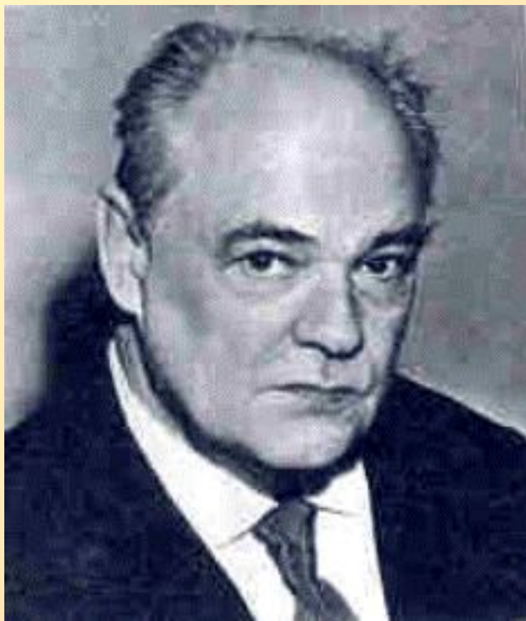
(1901-1965) писатель и художник-график Евгений Иванович Чарушин