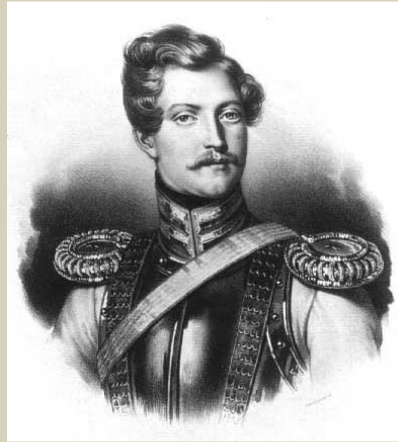
Бенар с оригинала неизвестного художника Ж. Дантес-Геккерн. 1830-е гг

В 1835 году появился повод к дуэли, когда молодой офицер Дантес начал ухаживать за Натальей Николаевной, чему она была не против.