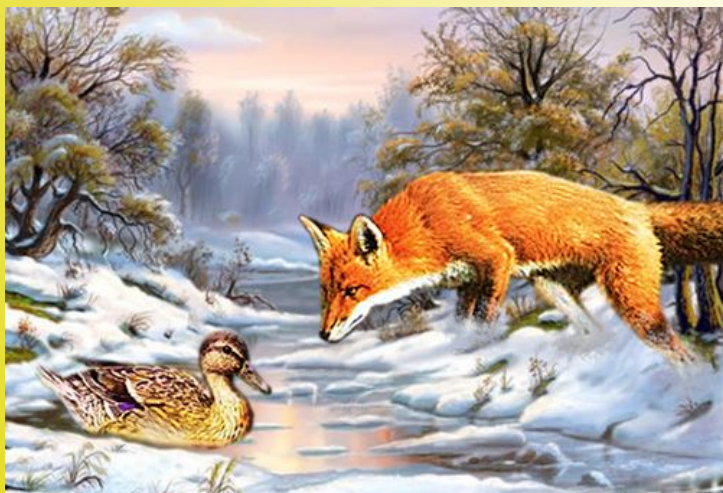
Не хочу разговаривать...