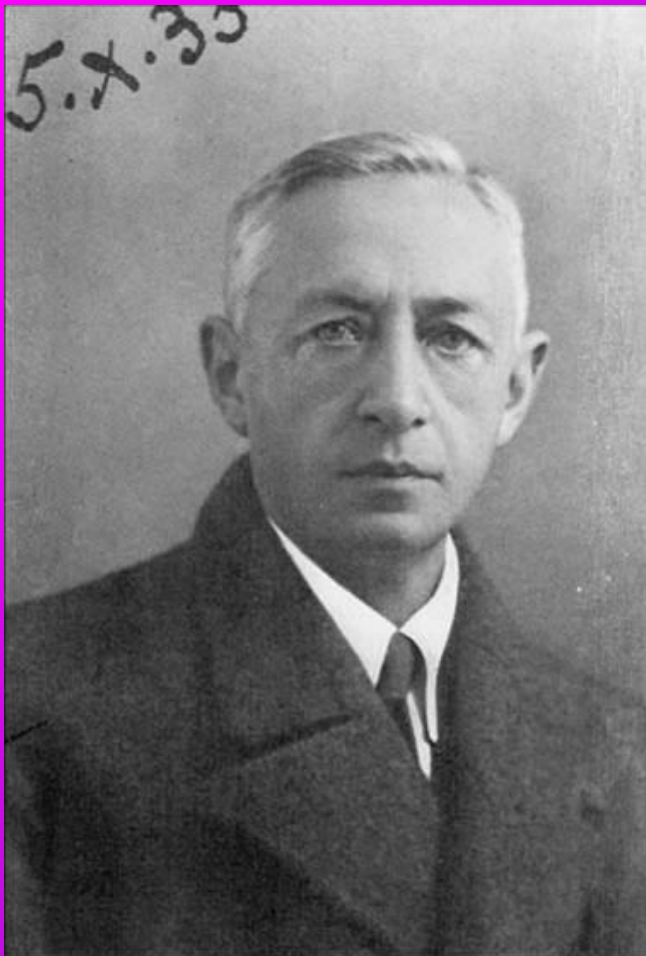
И.Бунин. 1933 г.