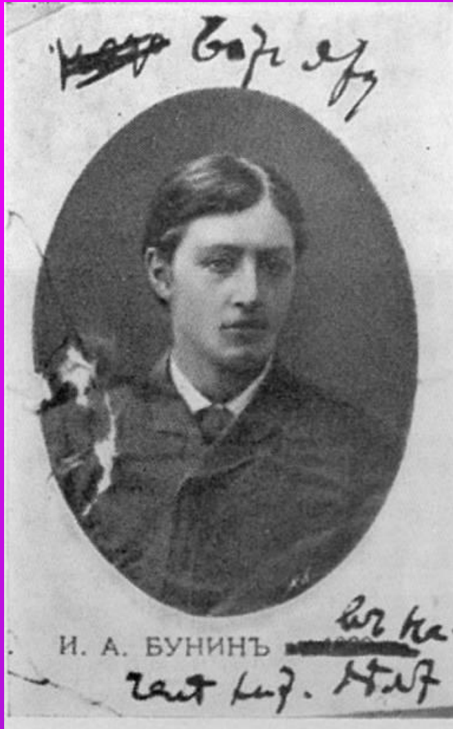
И.А.Бунин. 1889 г.

В 1886 г. И.Бунин уходит из гимназии, в дальнейшем занимается самообразованием под руководством старшего брата