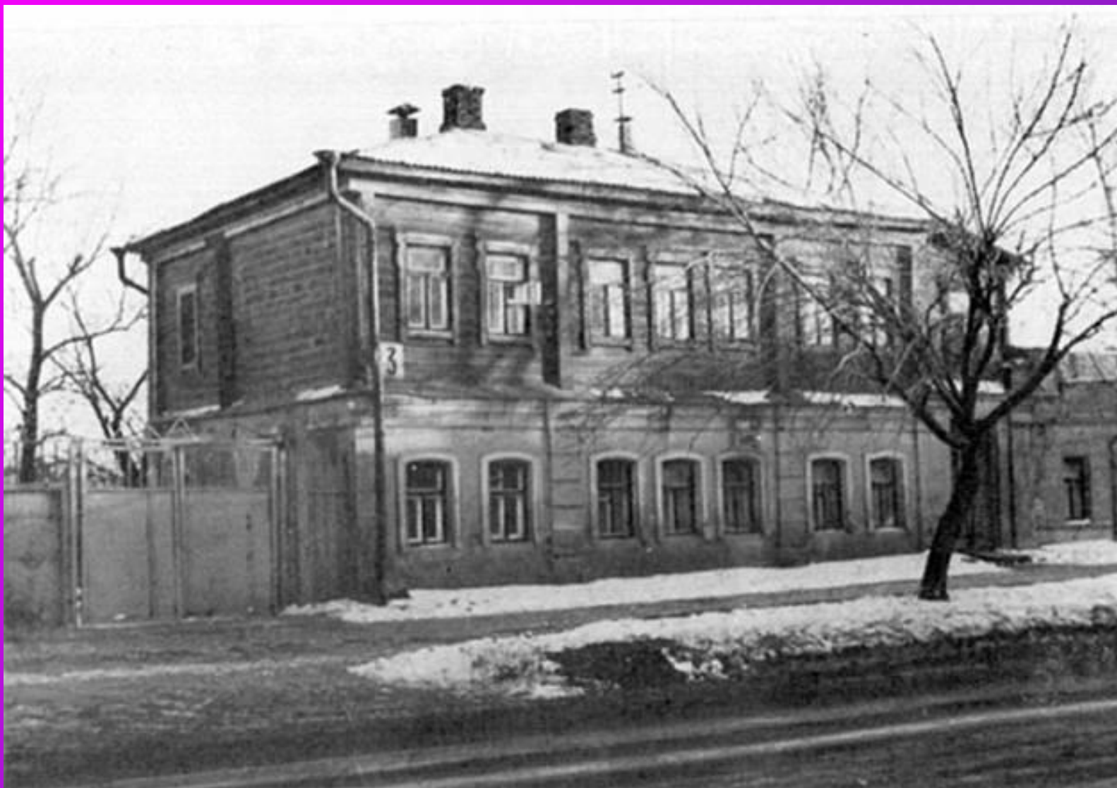
Воронеж. Дом, в котором родился И.А.Бунин. Детство и юность прошли в фамильном имении в Орловской губернии