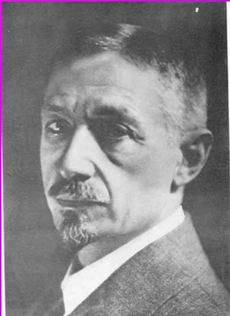
И.Бунин. Париж 1920 г.

«Я никогда не примирюсь, что разрушена Россия... Я никогда не думал, что могу так остро чувствовать»