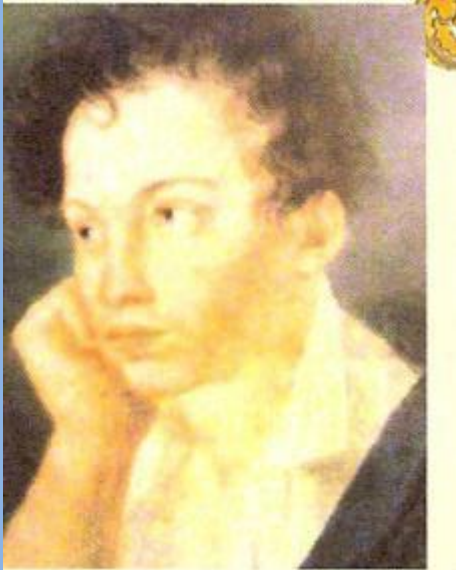
Пушкин в лицейские годы.

19 октября 1811 года – день торжественного открытия Лицея