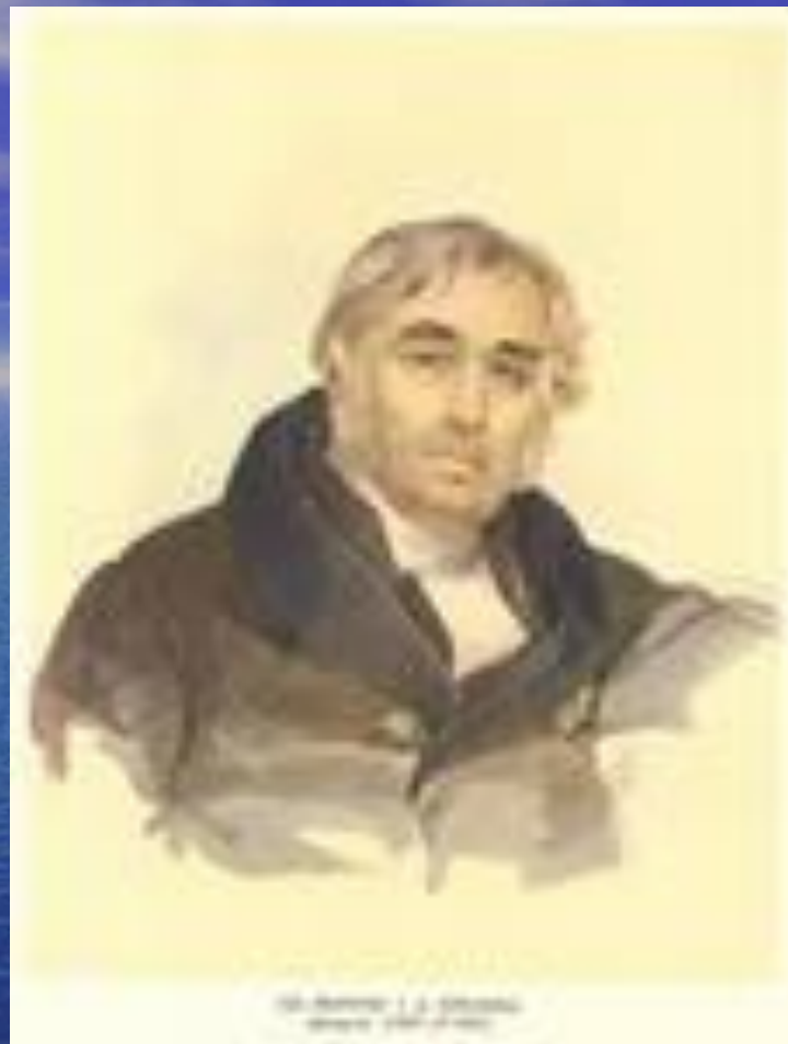
Иван Андреевич Крылов