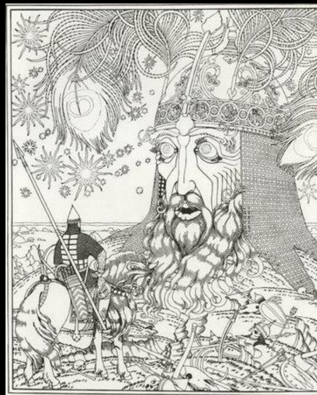
Руслан и Людмила