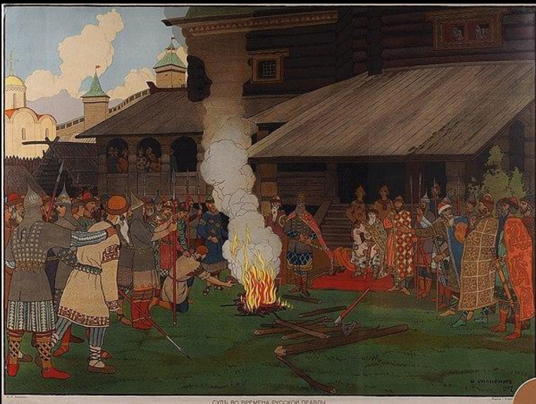
• Суд во время Русской Правды