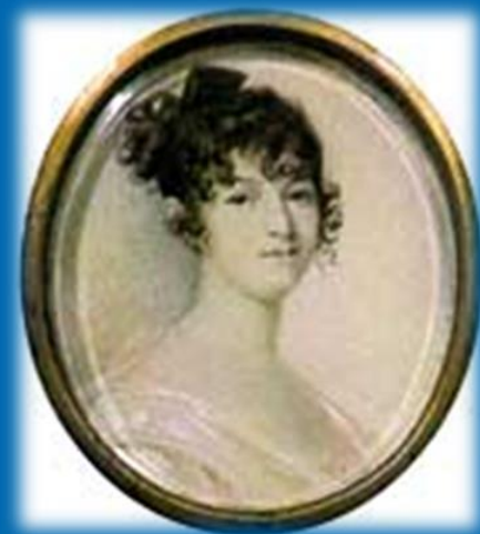
Мать, Надежда Осиповна Пушкина (1775-1836г.)