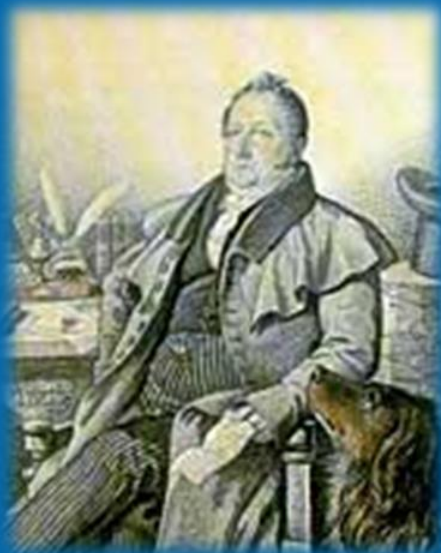
Отец, Сергей Львович Пушкин (1770-1838г.)