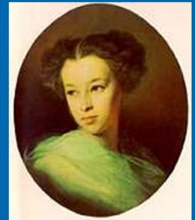
Младшая дочь, Наталья Александр овна Пушкина (1836-1913г.) Получила