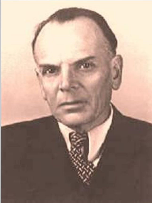
Георгий Константинович Паустовский

1.Писатель, описавший чудо в «Жильцах старого дома»»