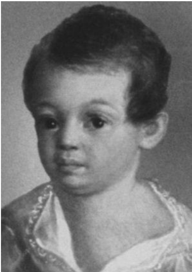
Александр Сергеевич Пушкин