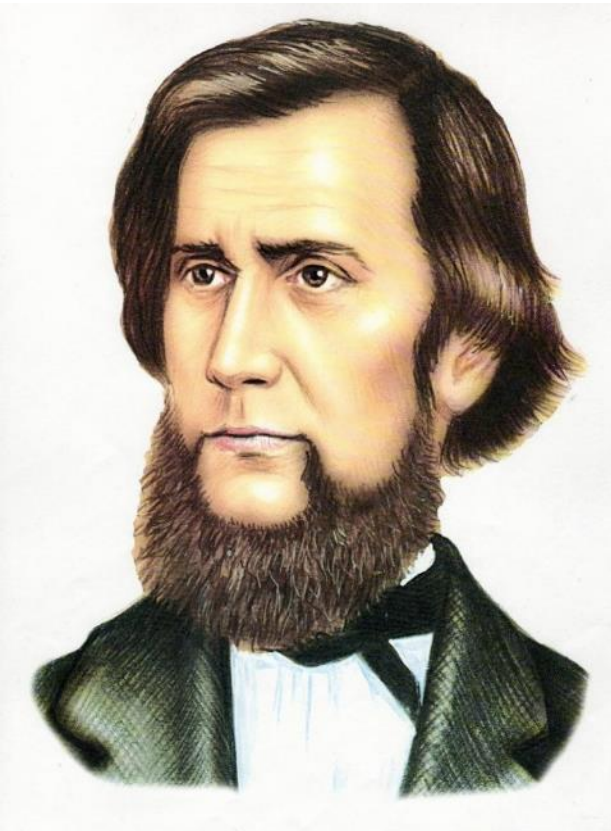
Константин Дмитриевич Ушинский