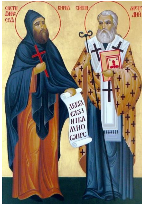
Кирилл и Мефодий