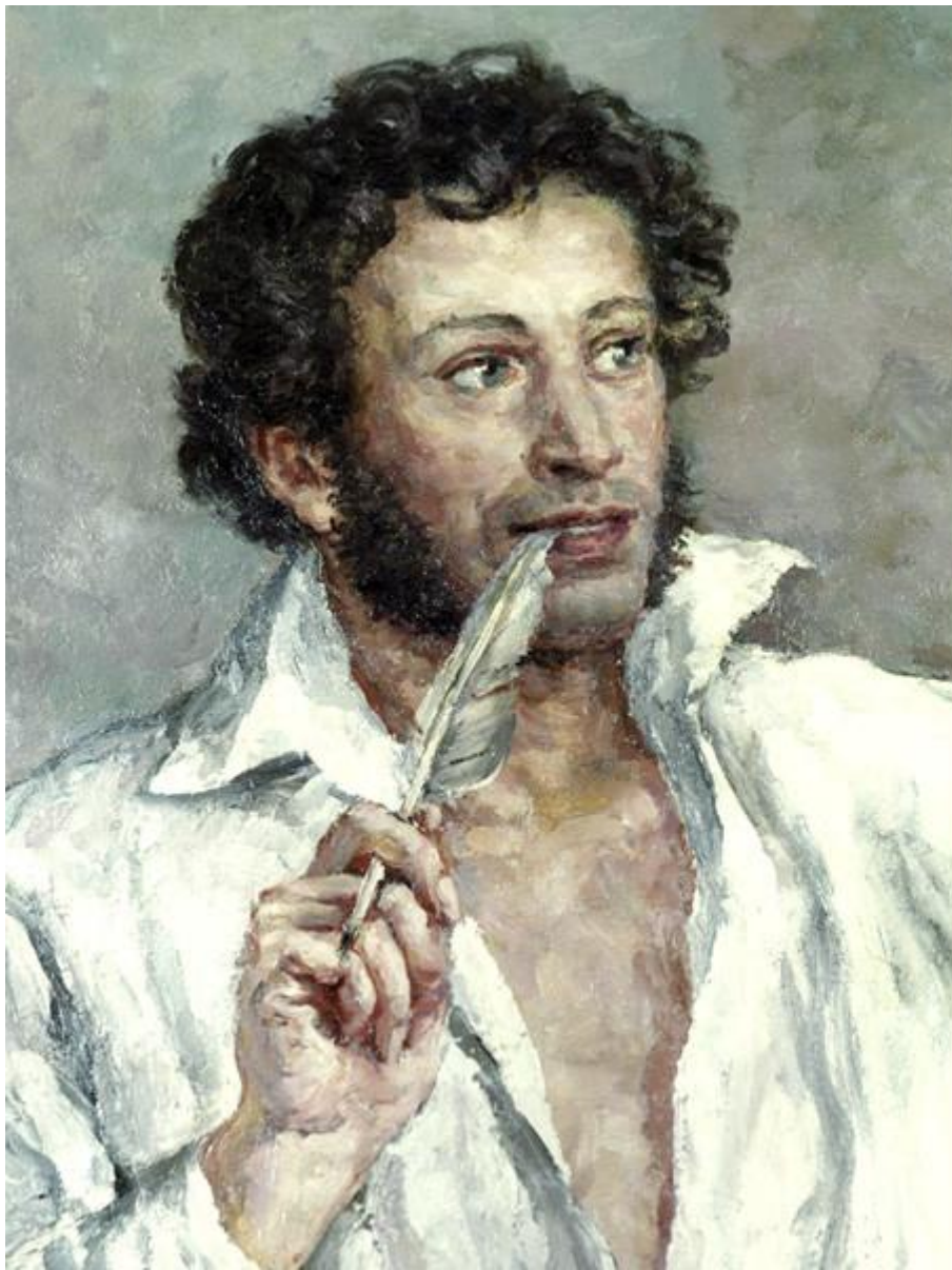
Александр Сергеевич Пушкин