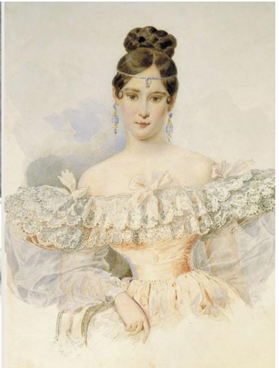
Наталья Николаевна Гончарова