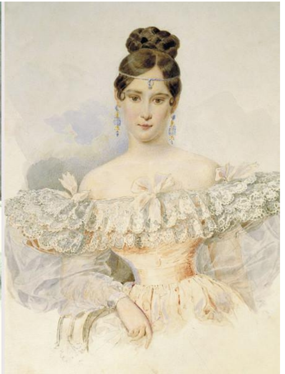
Наталья Николаевна Гончарова