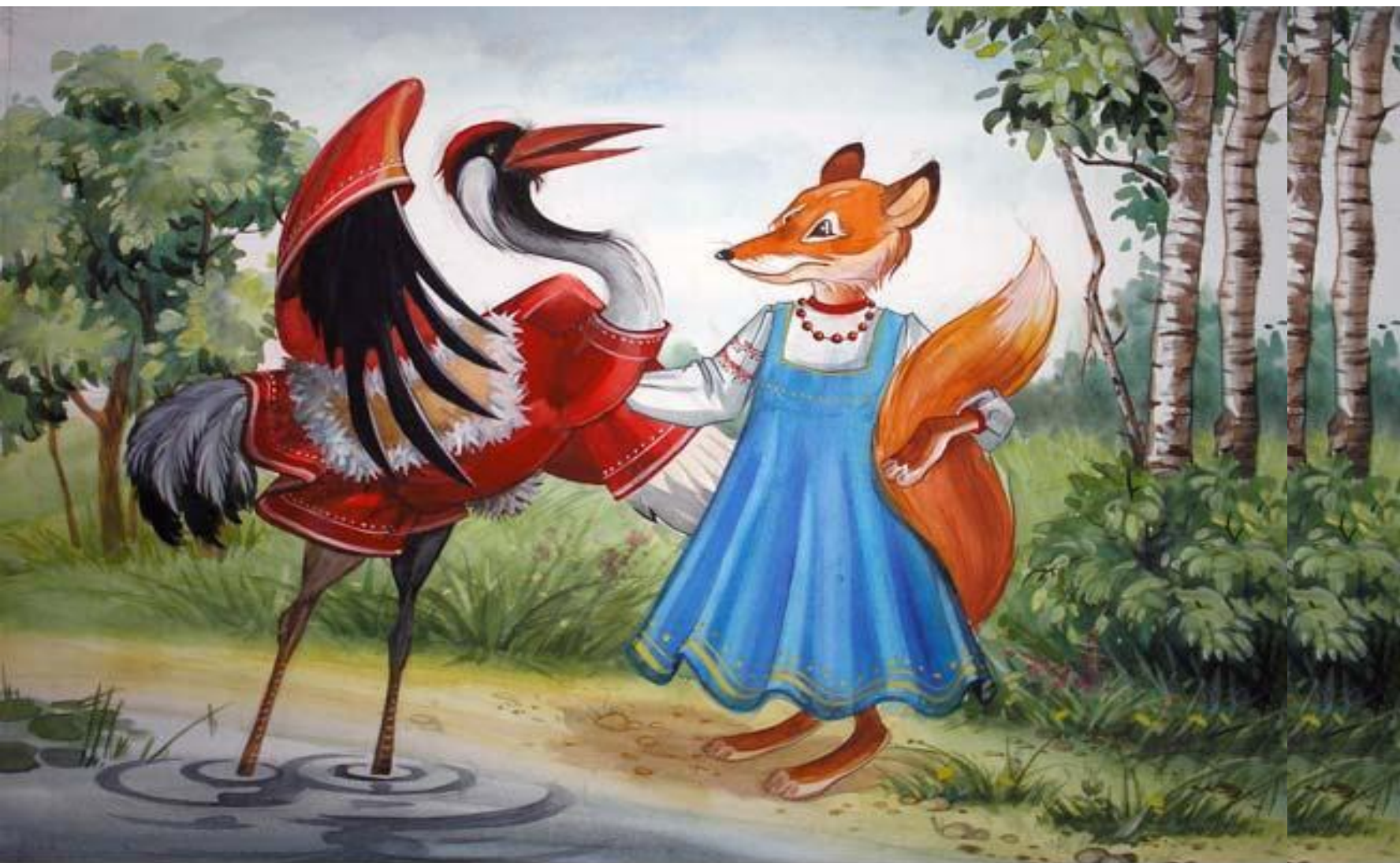
фрагмент 1 мент 1