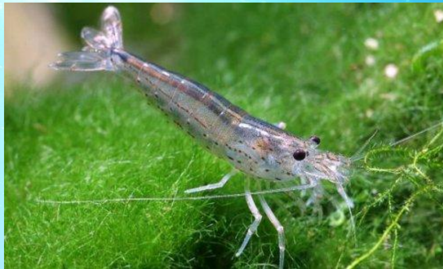
..., быстрые креветки