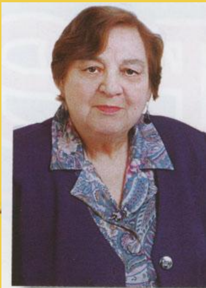
И.П. Токмакова 1929г