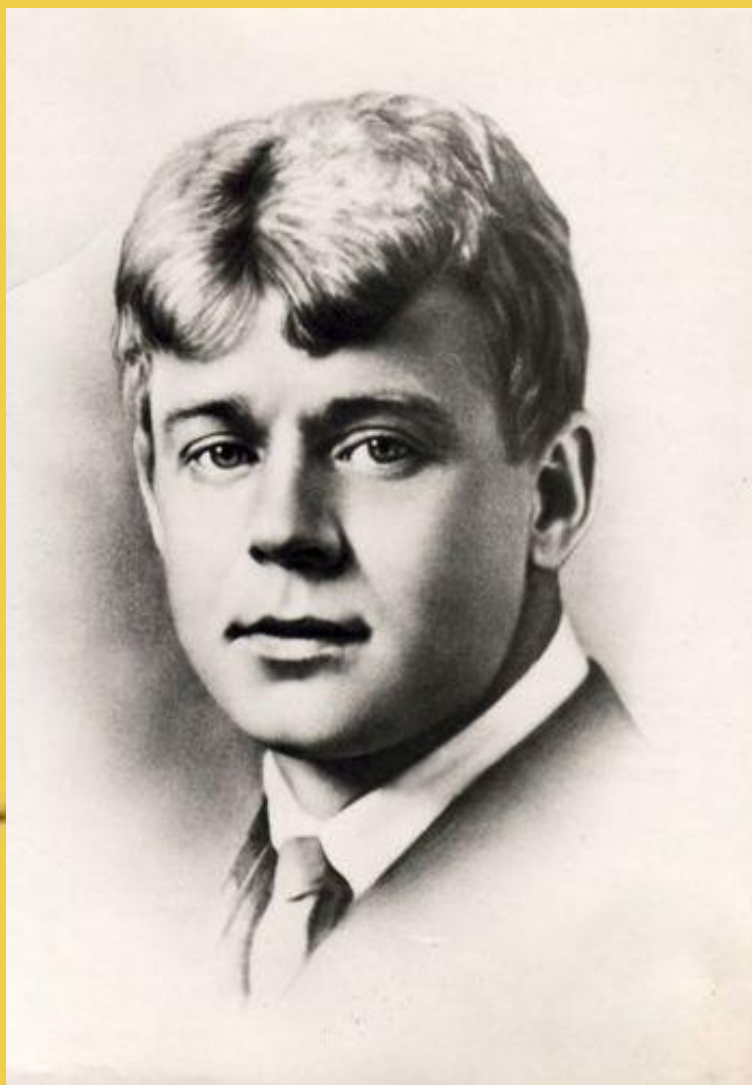
Сергей Есенин 1895-1925 г.