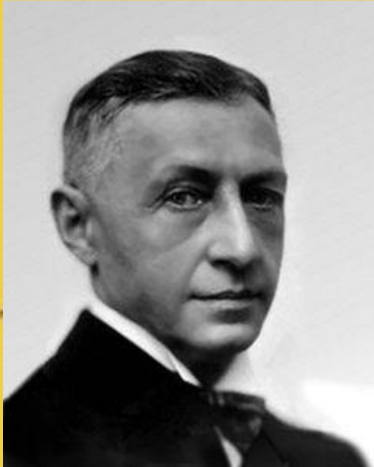
И. А. Бунин 1870-1953г.