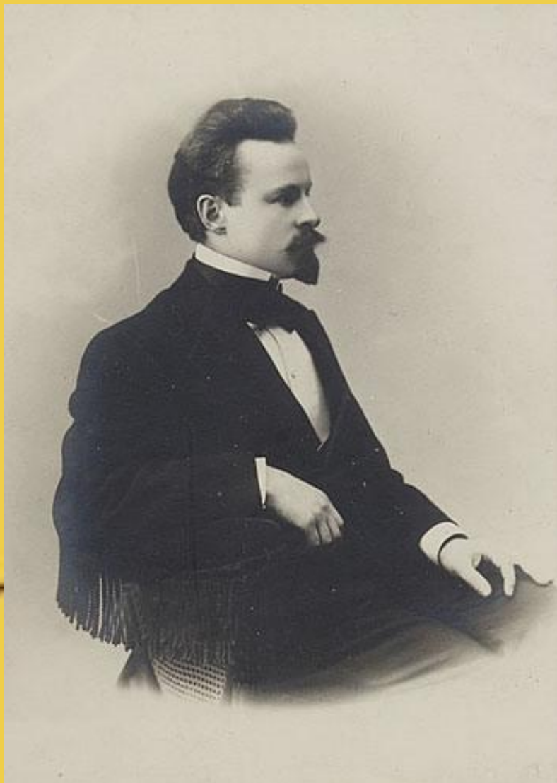
К. Д. Бальмонт 1867-1942 г.