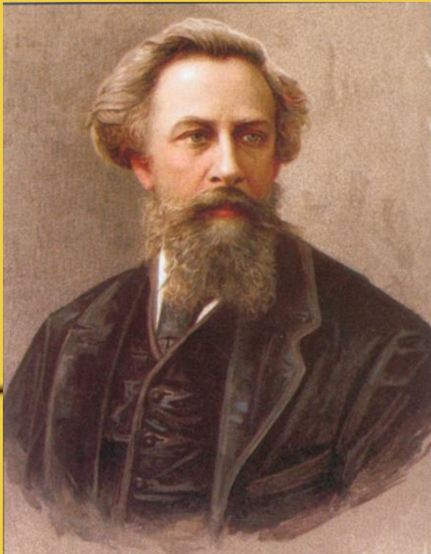
А. К. Толстой 1817 -1875г.