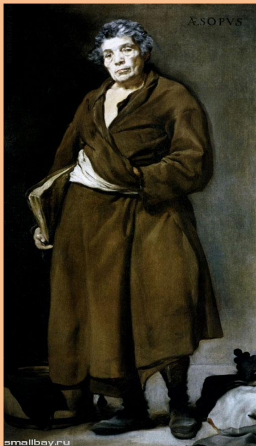
Эзоп (VI век до н.э.)