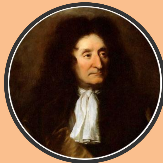
Жан де Лафонтен (1621-1695)