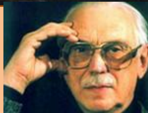
С.В. Михалков (1913-2009)