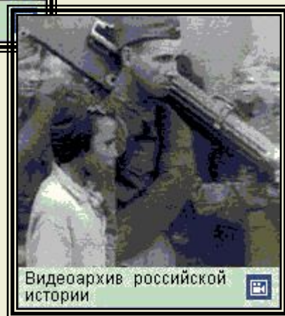
Видеоархив российской истории

Во время Великой Отечественной войны А.Барто выезжала на фронт с чтением своих стихов, выступала по радио, писала для газет.