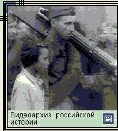
Видеоархив российской истории

Во время Великой Отечественной войны А.Барто выезжала на фронт с чтением своих стихов, выступала по радио, писала для газет.