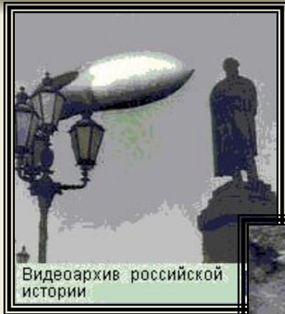
Видеоархив российской истории