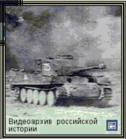
Видеоархив российской истории