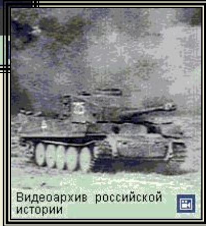
Видеоархив российской истории