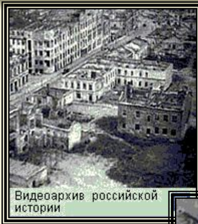
Видеоархив российской истории