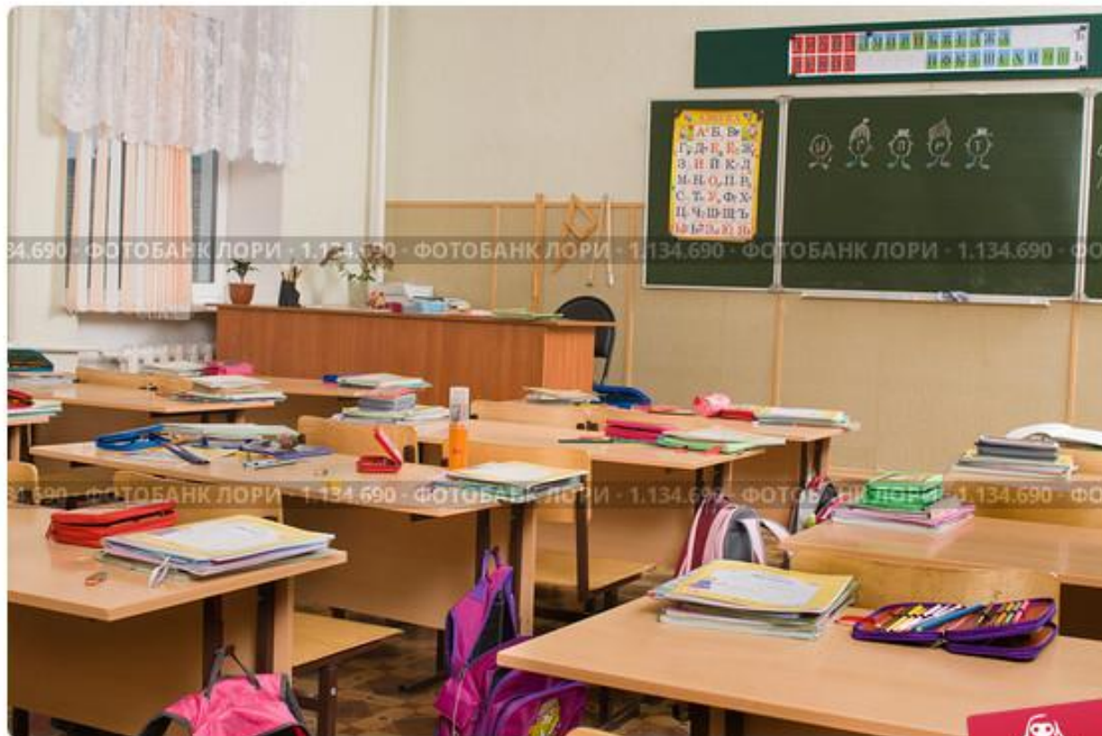
Интерьер классной комнаты в начальной школе