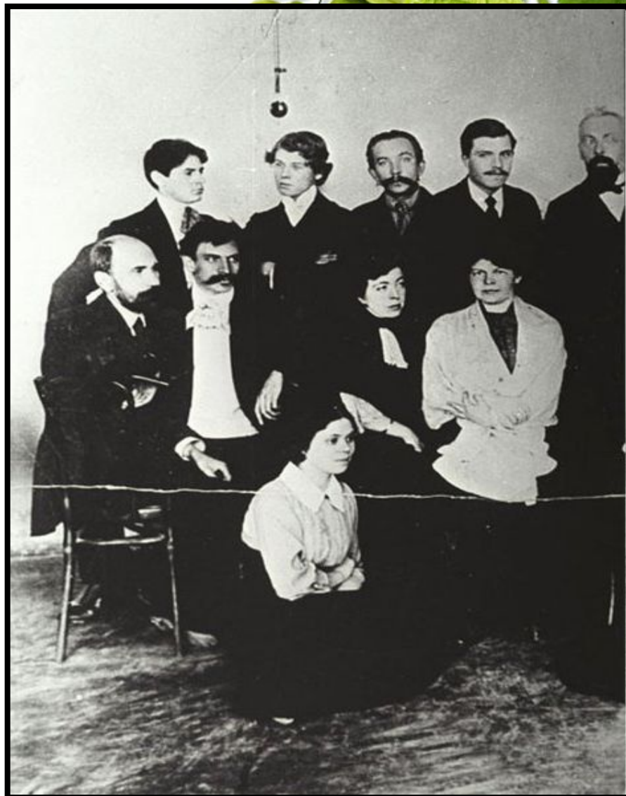
Сергей Есенин среди сотрудников типографии И. Д. Сытина.