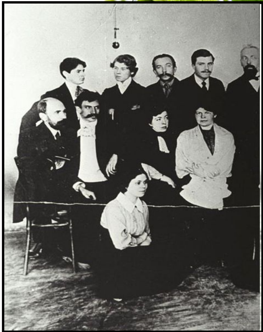
Сергей Есенин среди сотрудников типографии И. Д. Сытина.