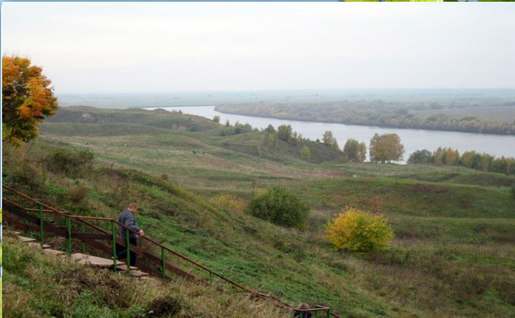
Село Константиново Рязанской губернии