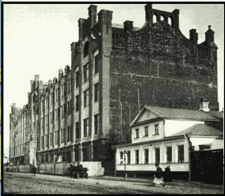
Здание типографии Товарищества И. Д. Сытина

Работал в книжном магазине, затем поступил в типографию товарищества И. Сытина — это давало будущему поэту возможность читать различную литературу.