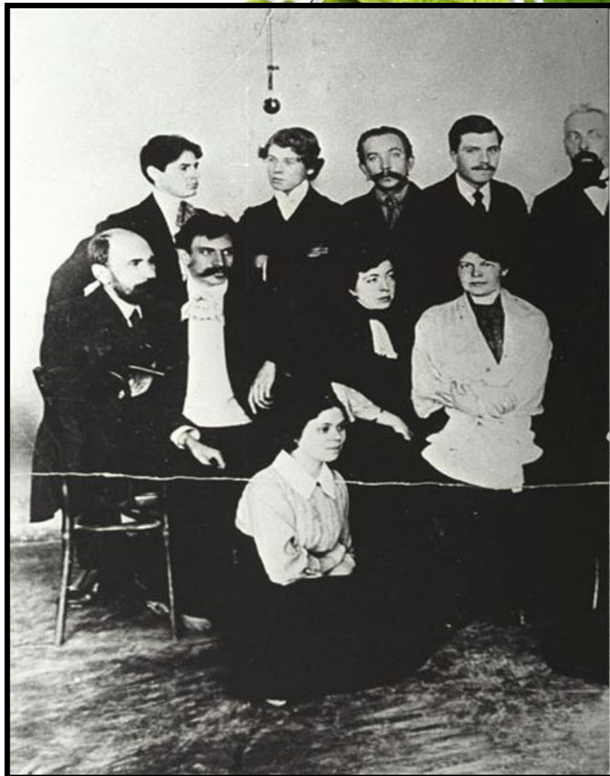
Сергей Есенин среди сотрудников типографии И. Д. Сытина.