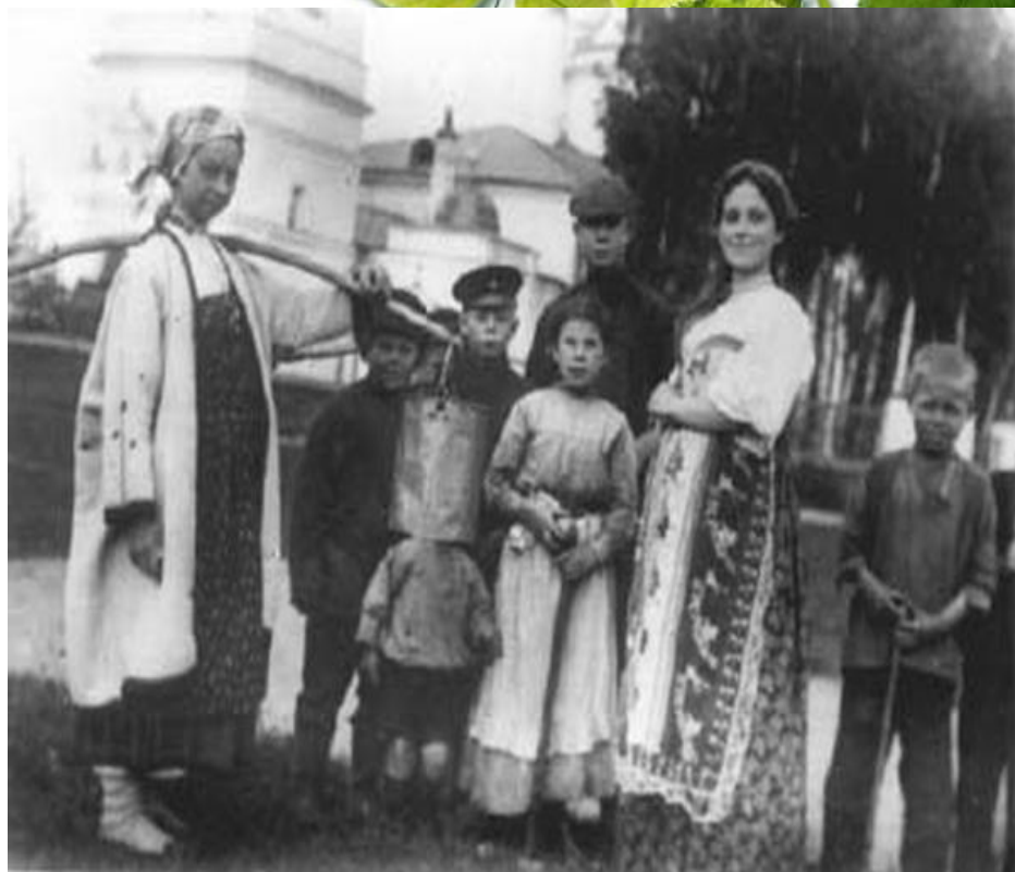
Жители села Константиново. Третий справа в кепке – Сергей Есенин