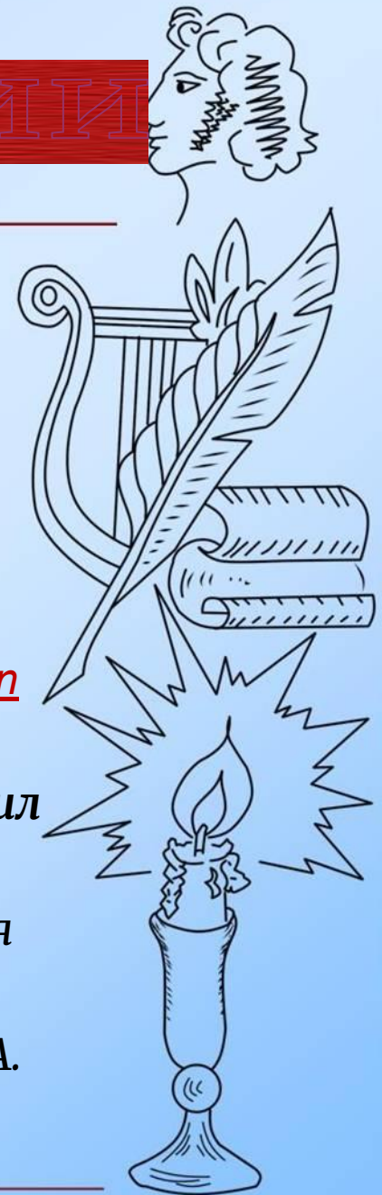
Рисунок справа сделан автором презентации Ранько Е.А. http://yandex.ru/ иллюстрации к сказкам Пушкина

http://i007.radikal.ru/0803/c9/1f2fdcf356d.png звёздочки для разделителя