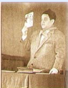
Виктор Драгунский знакомит читателей со своей новой книжкой про Дениску