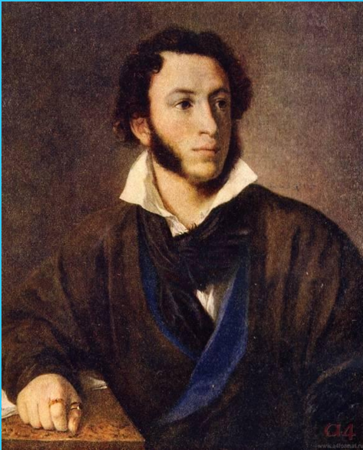
Александр Сергеевич Пушкин 1799-1837

И пробуждается поэзия во мне... И пальцы просят к перу, перо к бумаге, Минута – и стихи свободно потекут..