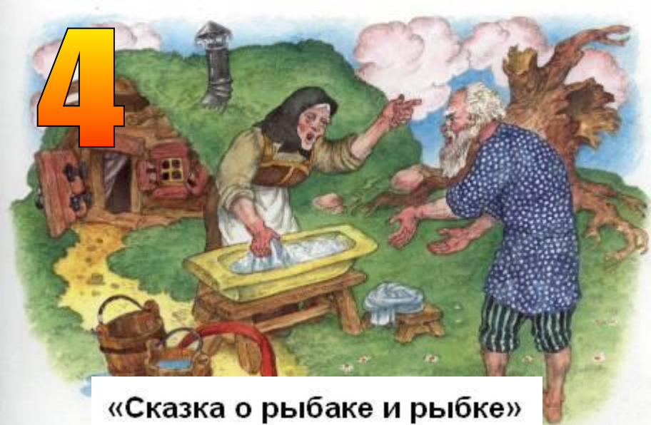
«Сказка о рыбаке и рыбке»