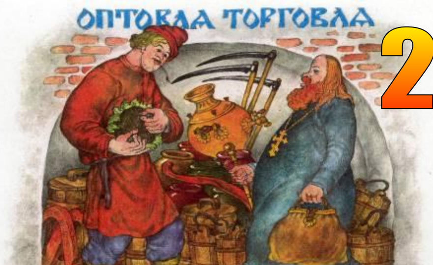
«Сказка о попе и о работнике его Балде»