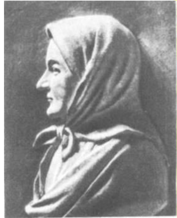
Арина Родионовна Я. П. Серяков. 1840-е гг.