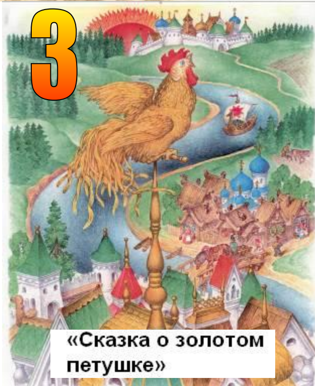
«Сказка о золотом петушке»