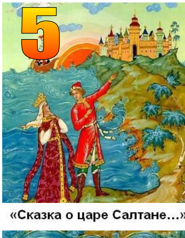
«Сказка о царе Салтане...»