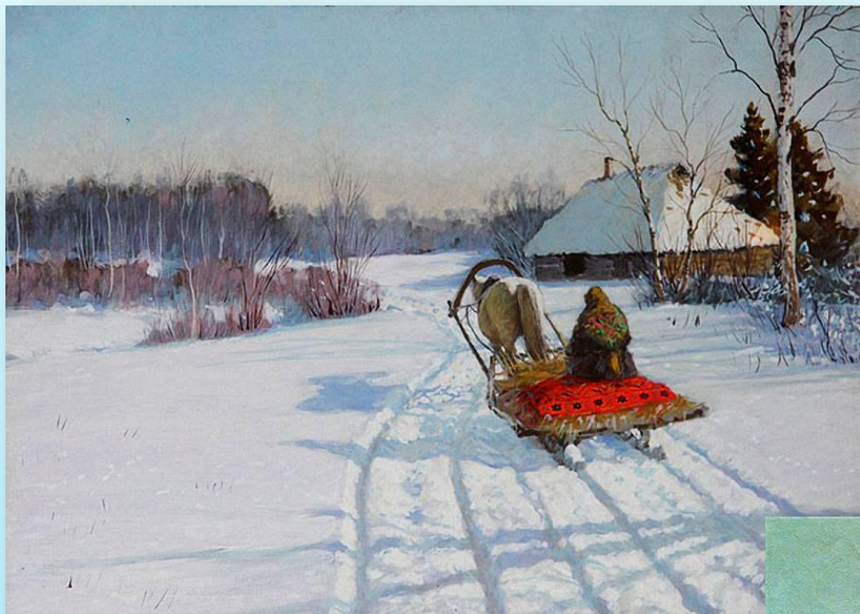
Андрей Афанасьевич Егоров «Зима»