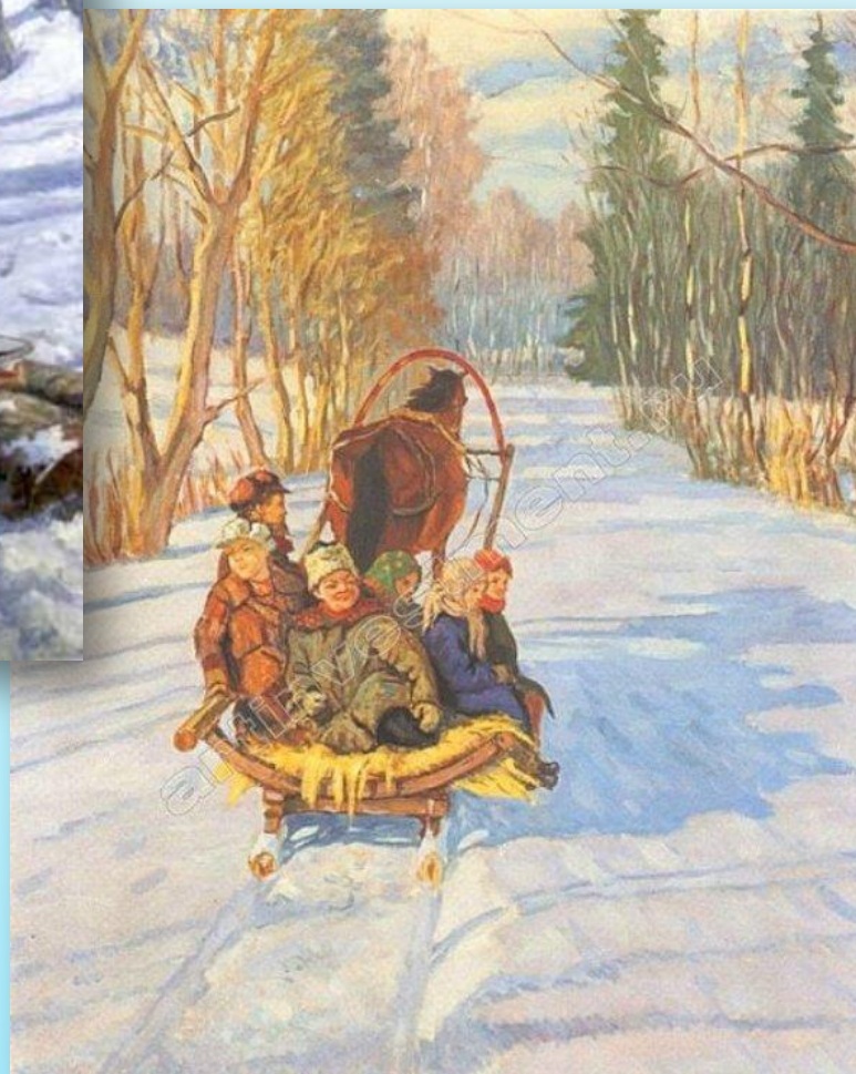
Николай Богданов-Бельский «Дети на санках»