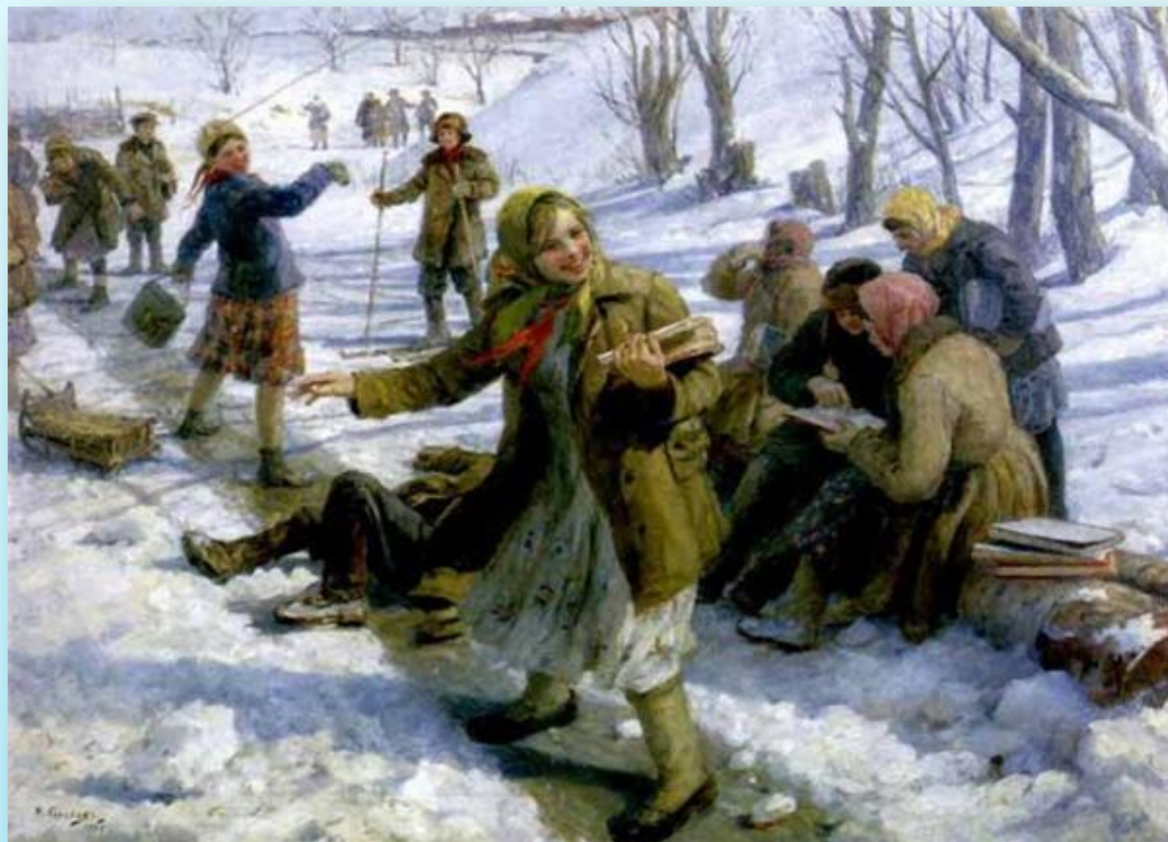
Сычков Федот Васильевич «Катание с горы»