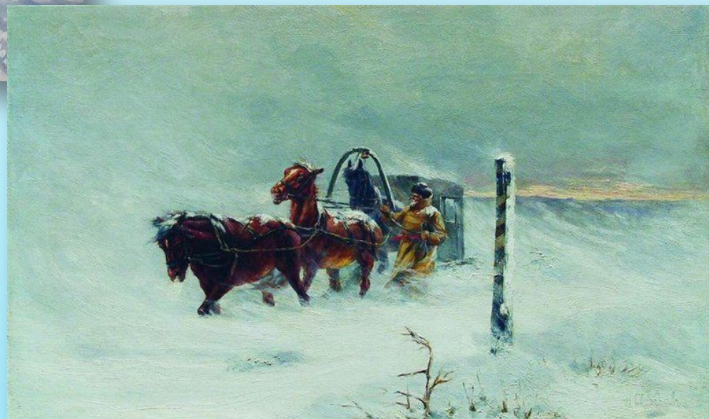
Сверчков Николай Егорович «Тройка»