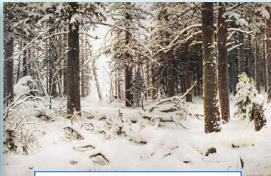
Иван Иванович Шишкин «Зима»